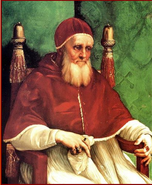
Папа Юлий II

Высшее руководство католической церкви, призывая народ жить в смирении и скромности, быть сдержанными в желаниях и стремлениях, соблюдать заповеди, само жили в роскоши: имело дворцы, проводило балы и пиры, оказывало покровительство родственникам.