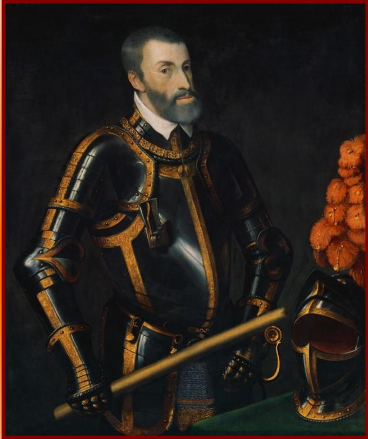
Император Карл V

После разгрома крестьянского восстания началась княжеская Реформация. Князья захватывали монастырские земли. Некоторые духовные князья отказывались от сана и становились светскими правителями. Но многие князья, боясь новых восстаний, остались верны католицизму. В 1529 г. император Карл V запретил лютеранство и присвоение церковного и монастырского имущества.