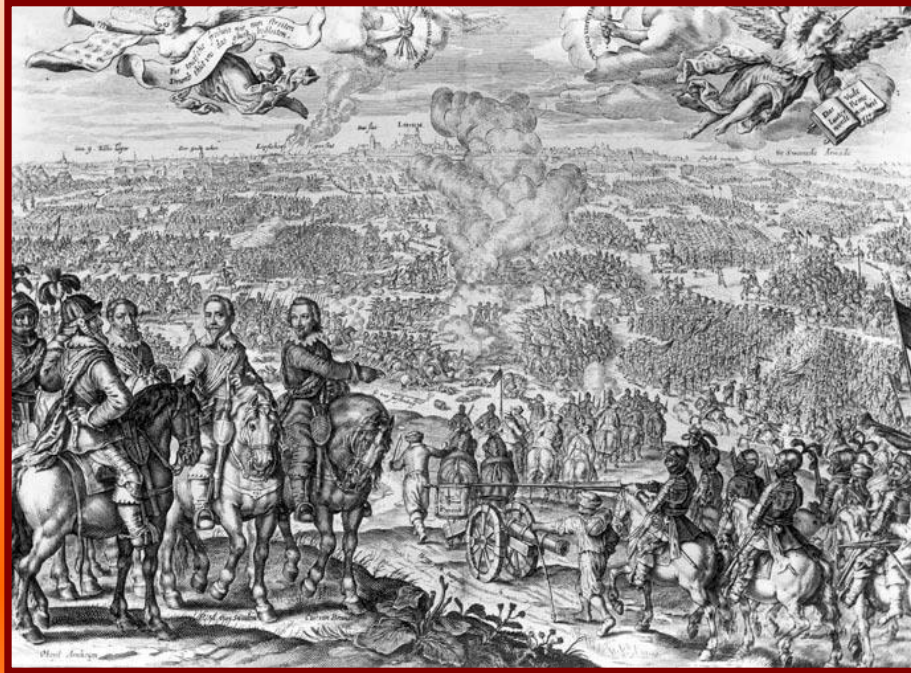
Религиозная война в Германии

Сторонники Лютера заявили императору протест, их стали называть протестантами . В Германии начались войны между католиками и протестантами. Боясь потерять власть, Карл V в 1555 г. в Аугсбурге заключил мир с протестантскими князьями. Устанавливалось равенство католиков и протестантов, князья получили право устанавливать религию на своих землях.