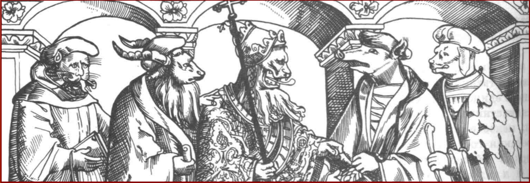
Папа и католические богословы. Карикатура 16 в.

Многие верующие совершившие паломничество в Рим были возмущены двуличием папы и кардиналов. Призывая народ к смирению, высшие руководители церкви вели роскошную жизнь, развлекались пирами и охотой, строили роскошные особняки себе и своим приближенным.