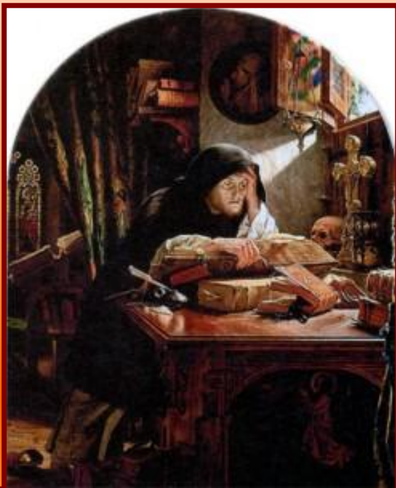
Мартин Лютер в Эрфурте

Мартин Лютер утверждал, что человек сам принимает решения, сам совершает поступки и сам несет за них ответственность.