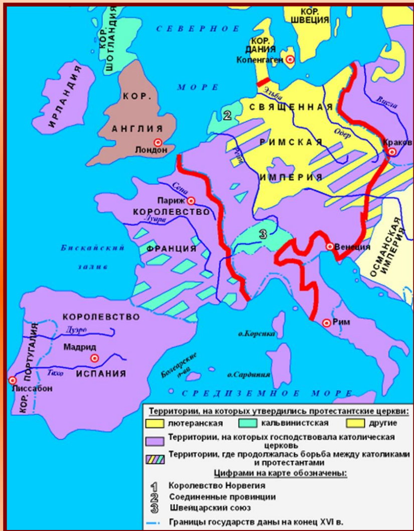
Распространение протестантизма в Европе

Северные и северо-восточные земли Германии, а также некоторые центральные княжества приняли лютеранство, а юг остался католическим. Князья заставили императора принять свою волю. Аугсбургский религиозный мир закрепил политическую раздробленность Германии и замедлил процесс ее объединения в единое государство.