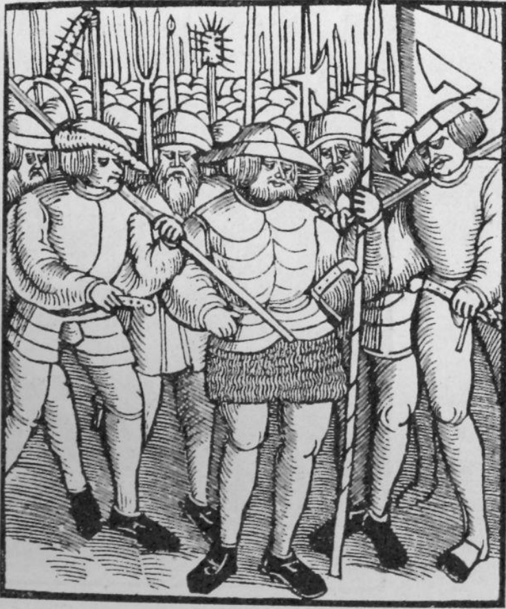
Титульный лист "Двенадцати статей"

Handlung/Artickel vnnnd Instruction / so fürgend men worden sein vnn allen Rottenn vnnnd hauffen der Pauren / so sich besamen verpflicht haben: M: D: xxv: