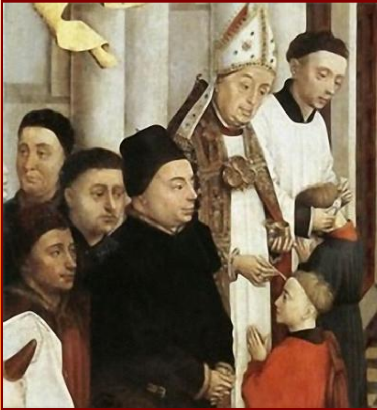
Обряд миропомазания в священники

В эпоху Возрождения мир стремительно менялся, а католическая церковь оставалась прежней. Новые научные открытия вступали в противоречие с религиозными догмами.