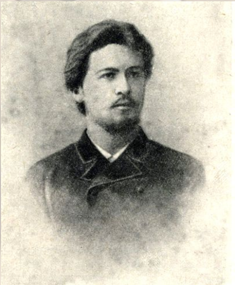
А.П. Чехов в первый год медицинской практики. Фотография 1865 г.