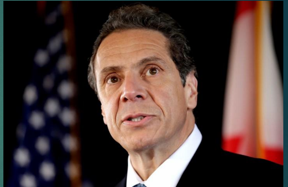
Губернатор штата Нью-Йорк Эндрю Куомо

В двух штатах кандидат должен быть не моложе 35 лет