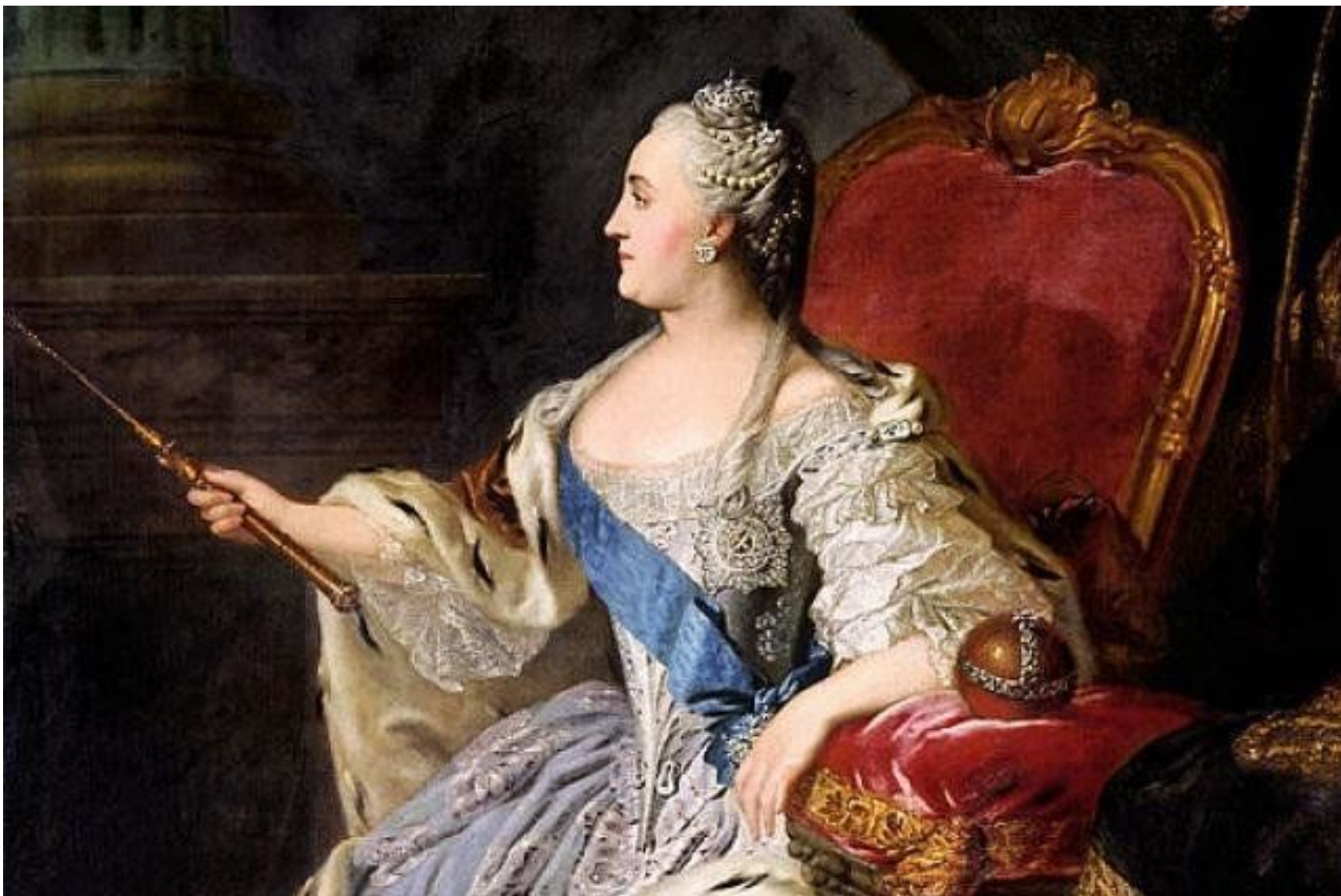
Ф.С. Рокотов , 1763 г. II