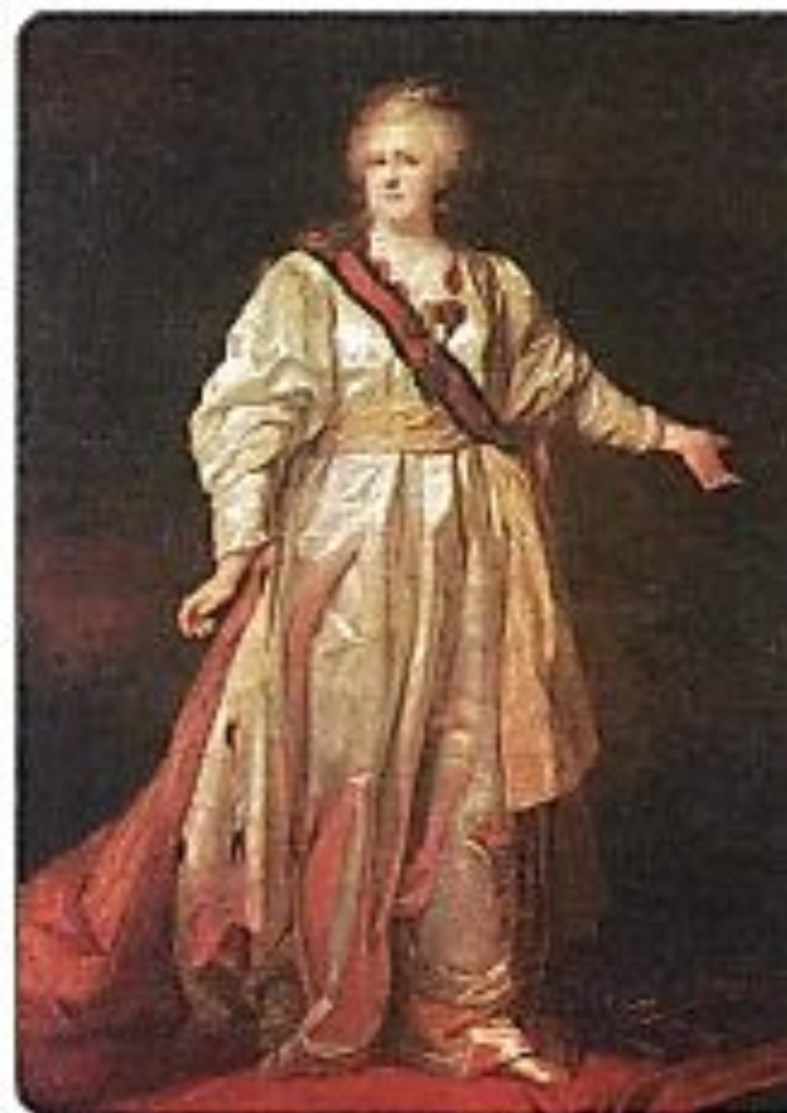
Екатерина II. Художник Д. Г. Левицкий

Императрица вставала в 6—7 часов утра и сразу начинала работу с бумагами, на туалет тратила «никогда не более часу», затем шли выходы, приёмы, обед, чтение документов до 18 часов — только после этого можно было погулять, сыграть в карты или сходить в театр, в 22 часа ложилась спать — и так 30 с лишним лет. Хладнокровие сочеталось в ней с честолюбием.