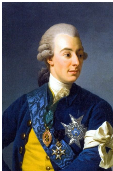
Густав III Швеция