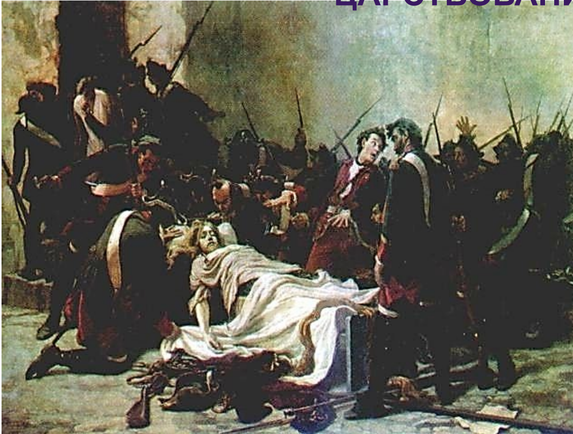
Мирович перед телом Ивана VI. Картина Ивана Творожникова (1884)