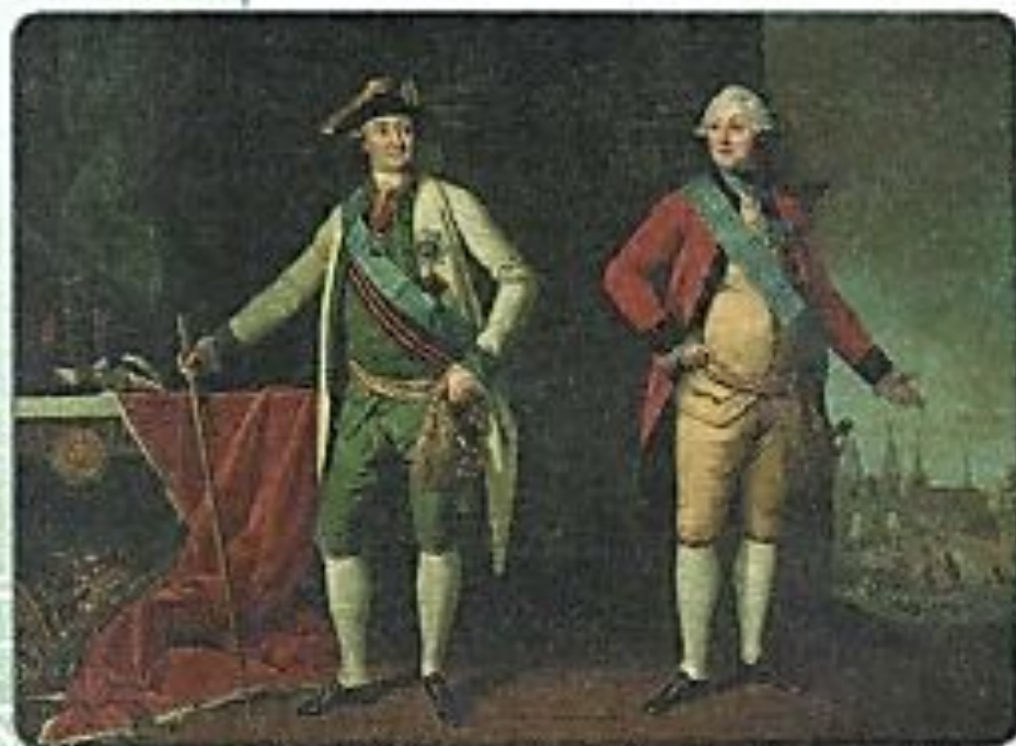
Братья А. Г. и Г. Г. Орловы. Картина XVIII в.

России. Искренний патриотизм и обаяние сочетались у Екатерины с отсутствием угрызений совести, к соперникам в борьбе за власть она была беспощадна.