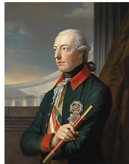
Иосиф II Австрия