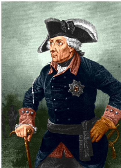
Фридрих II Пруссия

«Просвещённый абсолютизм» - политика абсолютизма в ряде европейских стран второй половины XVIII века, которая выражалась в преобразовании наиболее устаревших сторон жизни общества по инициативе монарха-реформатора