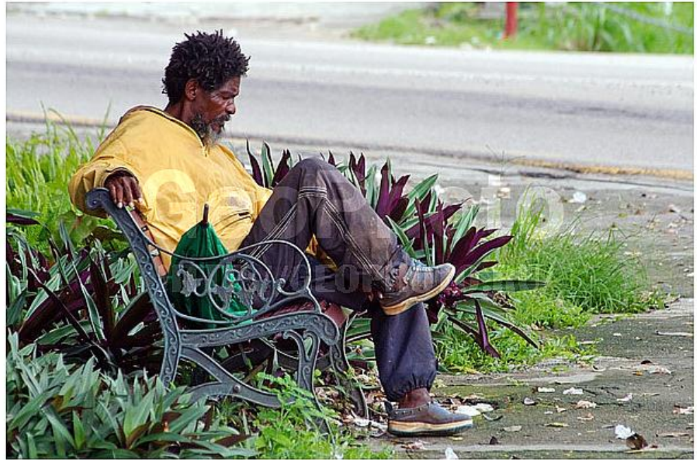
# nek037143 Seychelles, Republic of Seychelles

ВВП - 930 млн. долл. США (январь 2014 г.). Национальный доход на душу населения - 8 100 долл. США (март 2014 г.) - один из самых высоких в Африке. Бесплатное образование и медицинское обслуживание. Низкая детская смертность - 13 на 1000 рождений.