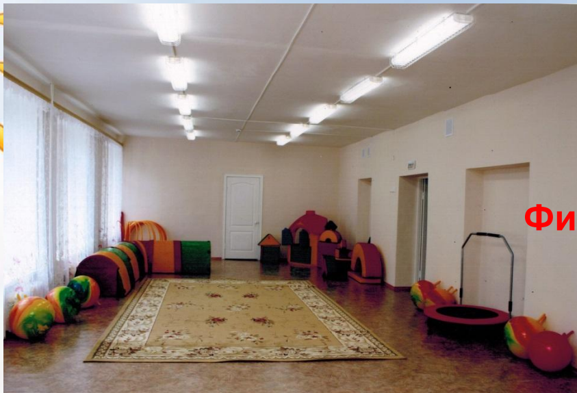
Физкультурный зал 2008 год