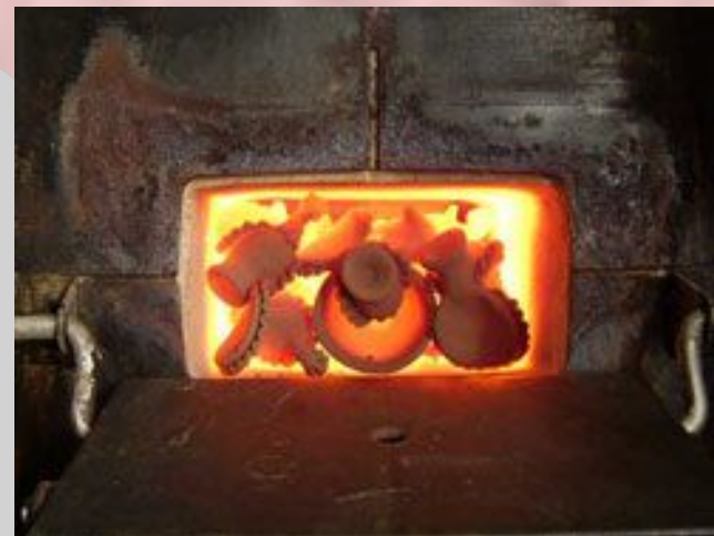
Сегодня обжиг производится в муфельных печах