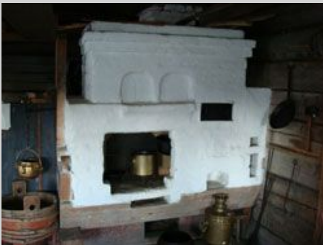
Ранее обжиг игрушки производился в русских печах