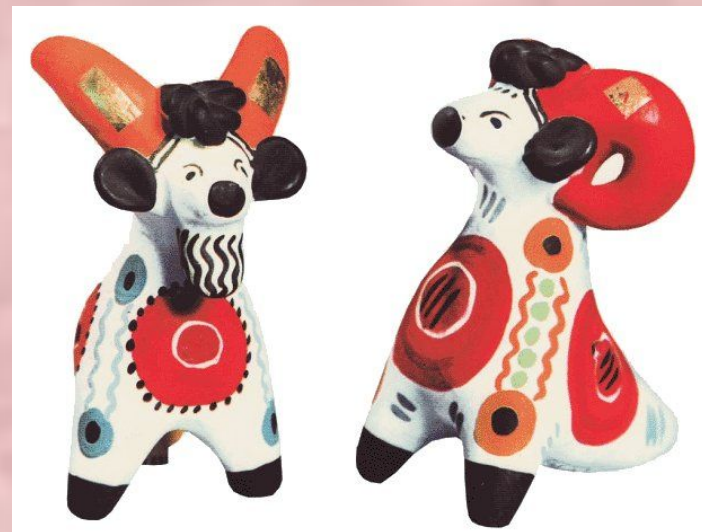
Свистульки-Козёл и Баран