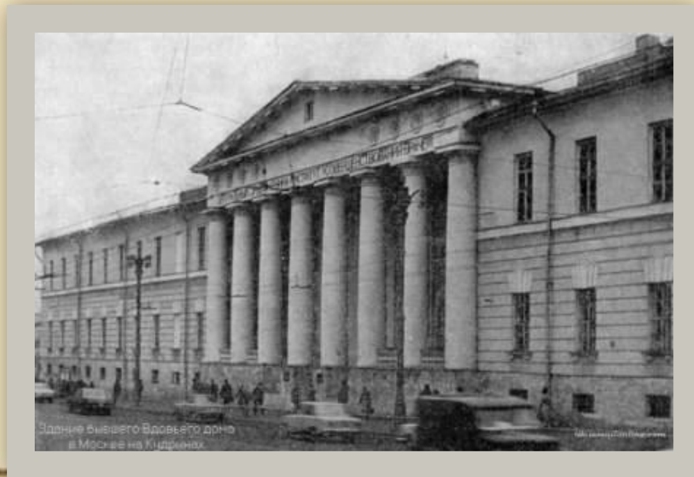
Здание бывшего Власьева дома в Москве на Кидринах.

Александр Иванович Куприн родился 26 августа 1870 года в захолустном городке Наровчате Пензенской губернии. Отца маленький Саша не помнил, так он умер через год после его рождения. Когда Саше исполнилось 4 года он переехал с матерью в Москву, где они поселились в казенном учреждении для дворянских вдов (вдовый дом).