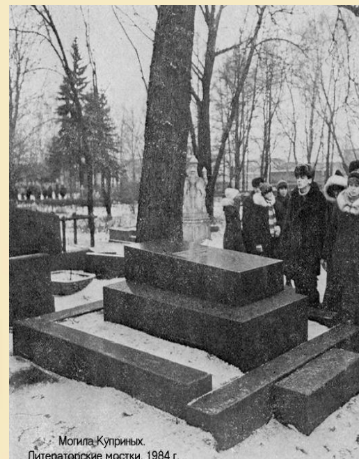
Могила Куприных. Литераторские мостки. 1984 г.