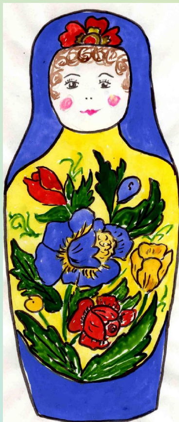
Полхов - Майданская