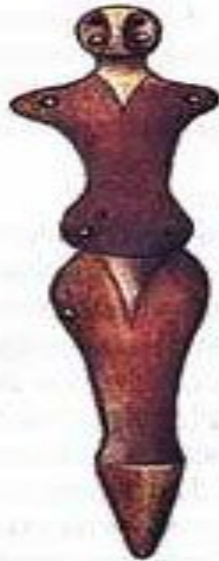
Жіноче божество родючості трипільців

Головним божеством трипільців була богиня родючості. У трипільській культурі створено основу для появи писемності у вигляді глиняних знаків на кераміці.