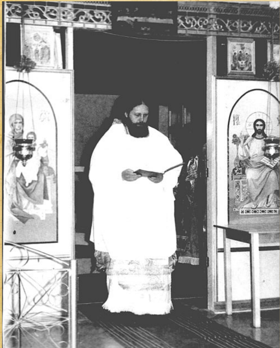
Архиепископ Алексий (Кутепов) в день освящения храма. 23 января 1994 года