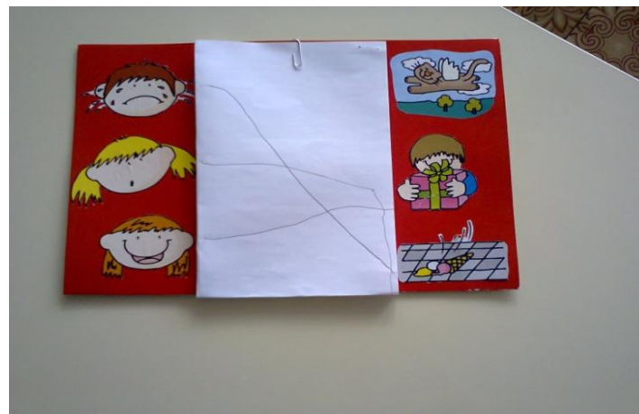
Дидактическая игра «Подбери эмоцию»