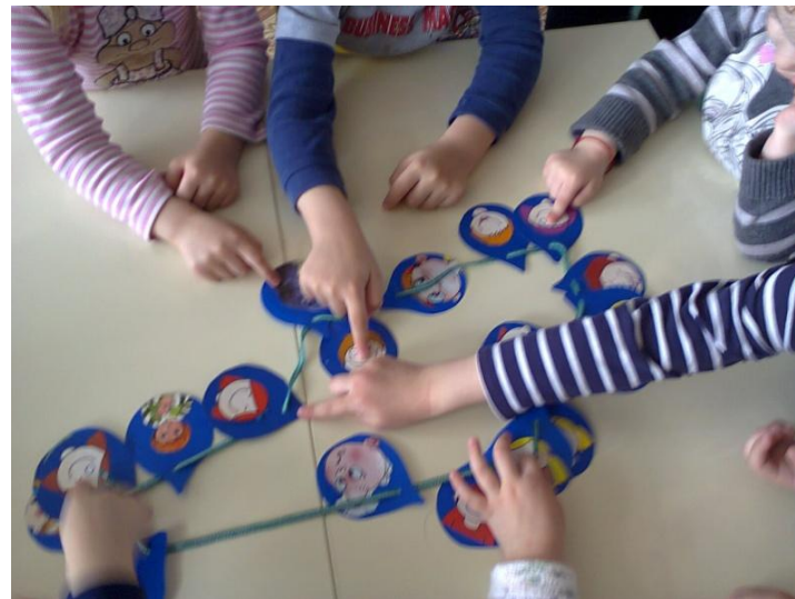
Дидактическая игра «Капельки настроения»