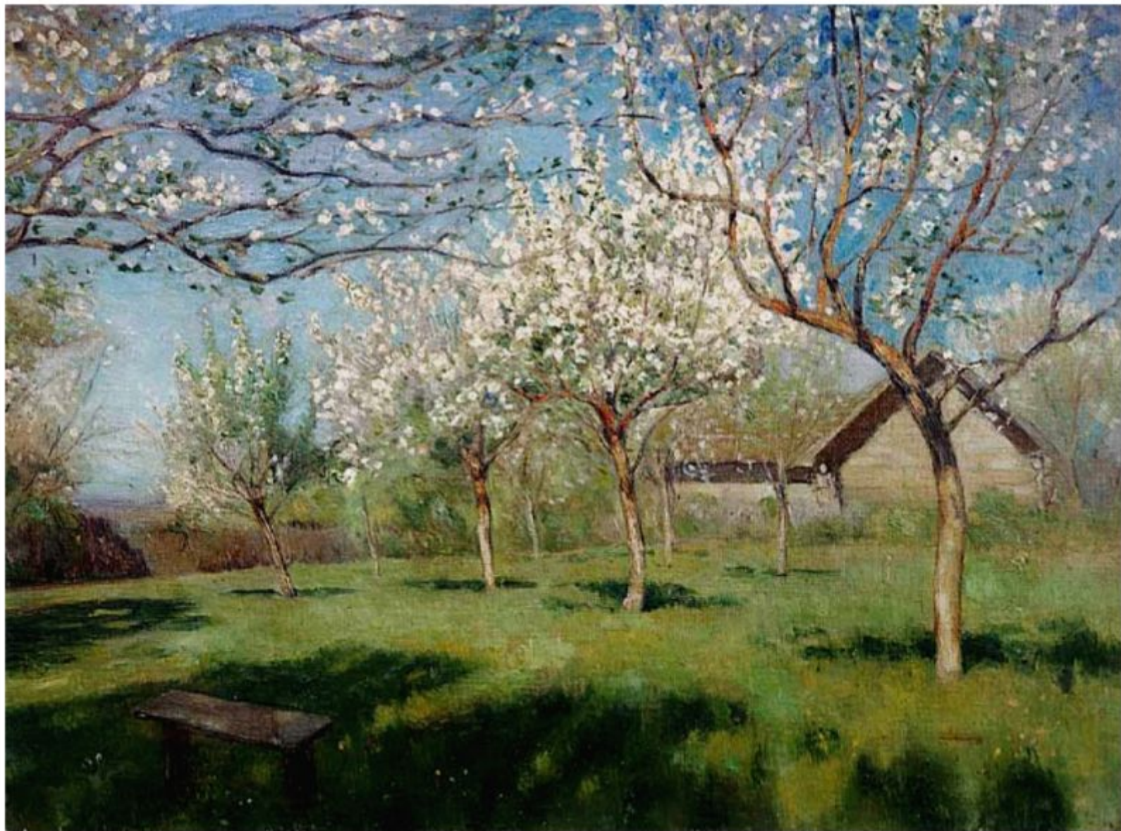
Исаак Левитан «Цветущие яблони»