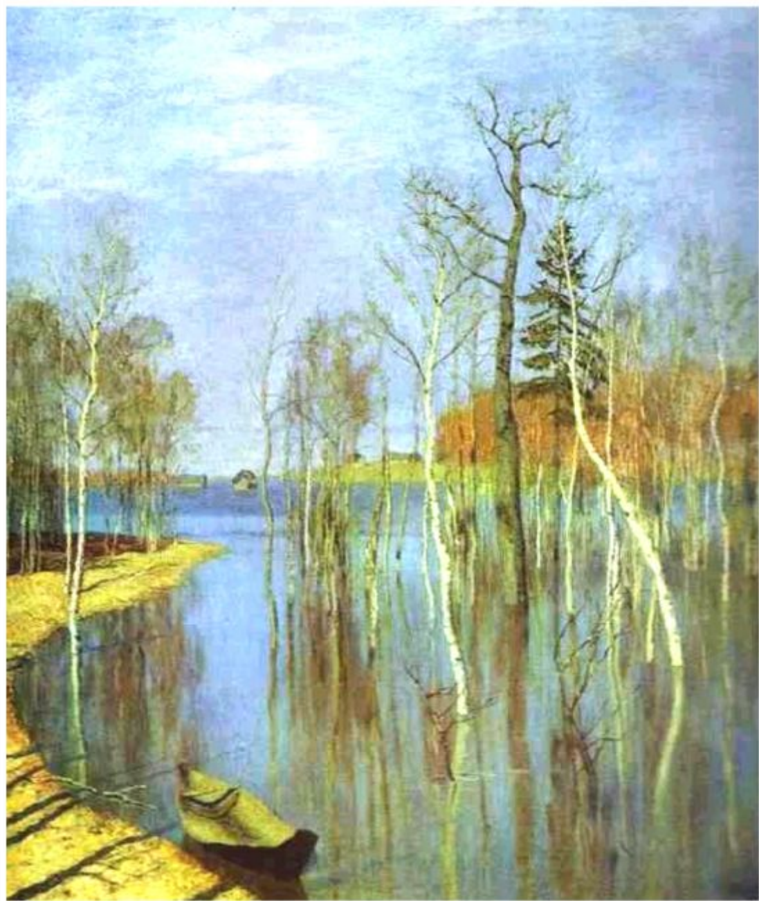
Исаак Левитан «Весна. Большая вода»