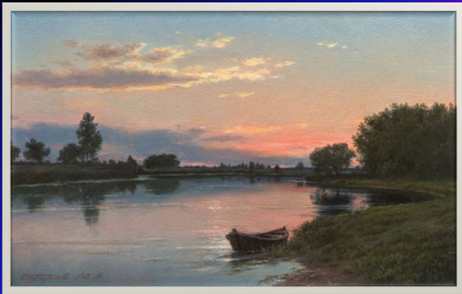
Михаил Сатаров «Закат»