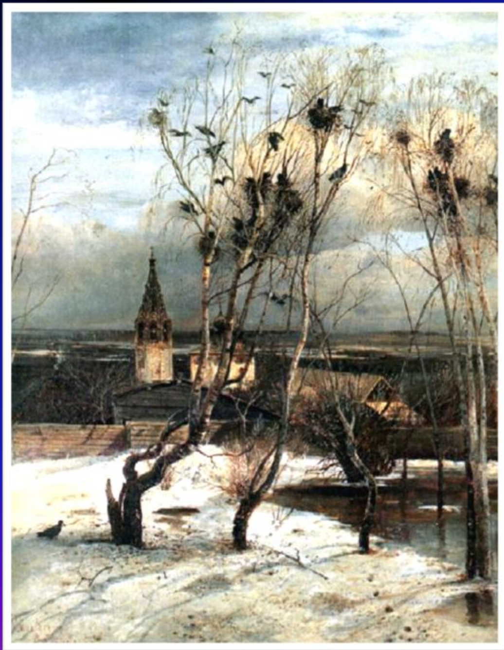
Алексей Саврасов. «Грачи прилетели»