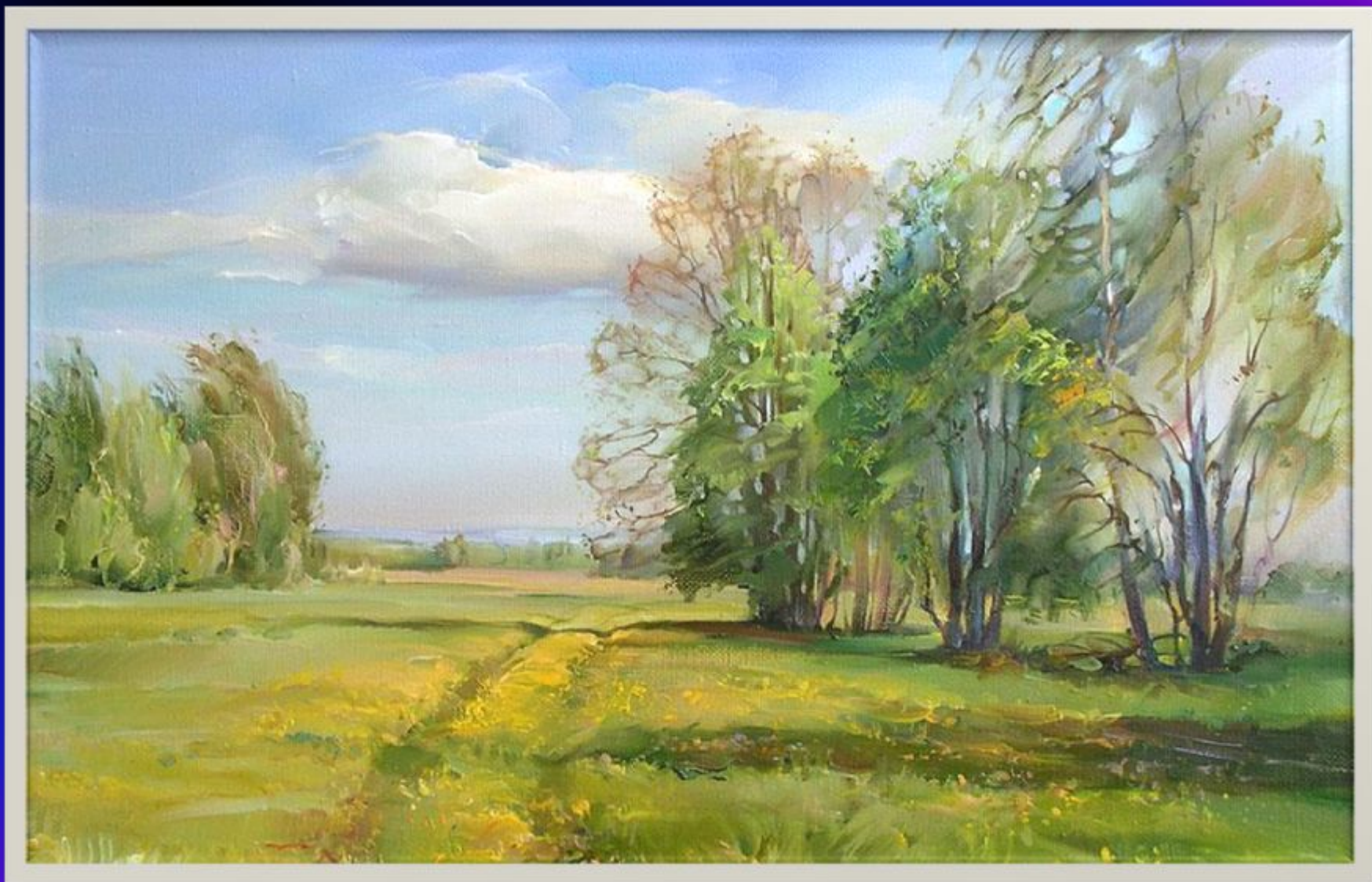
Роман Романов «Весенний ветер»