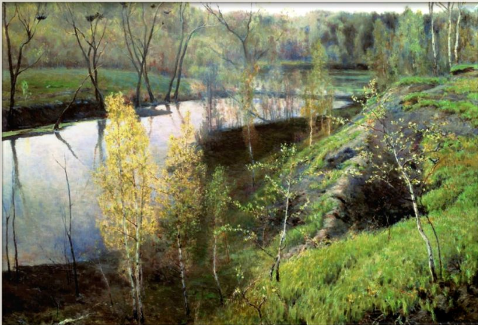
Илья Остроухов «Первая зелень»