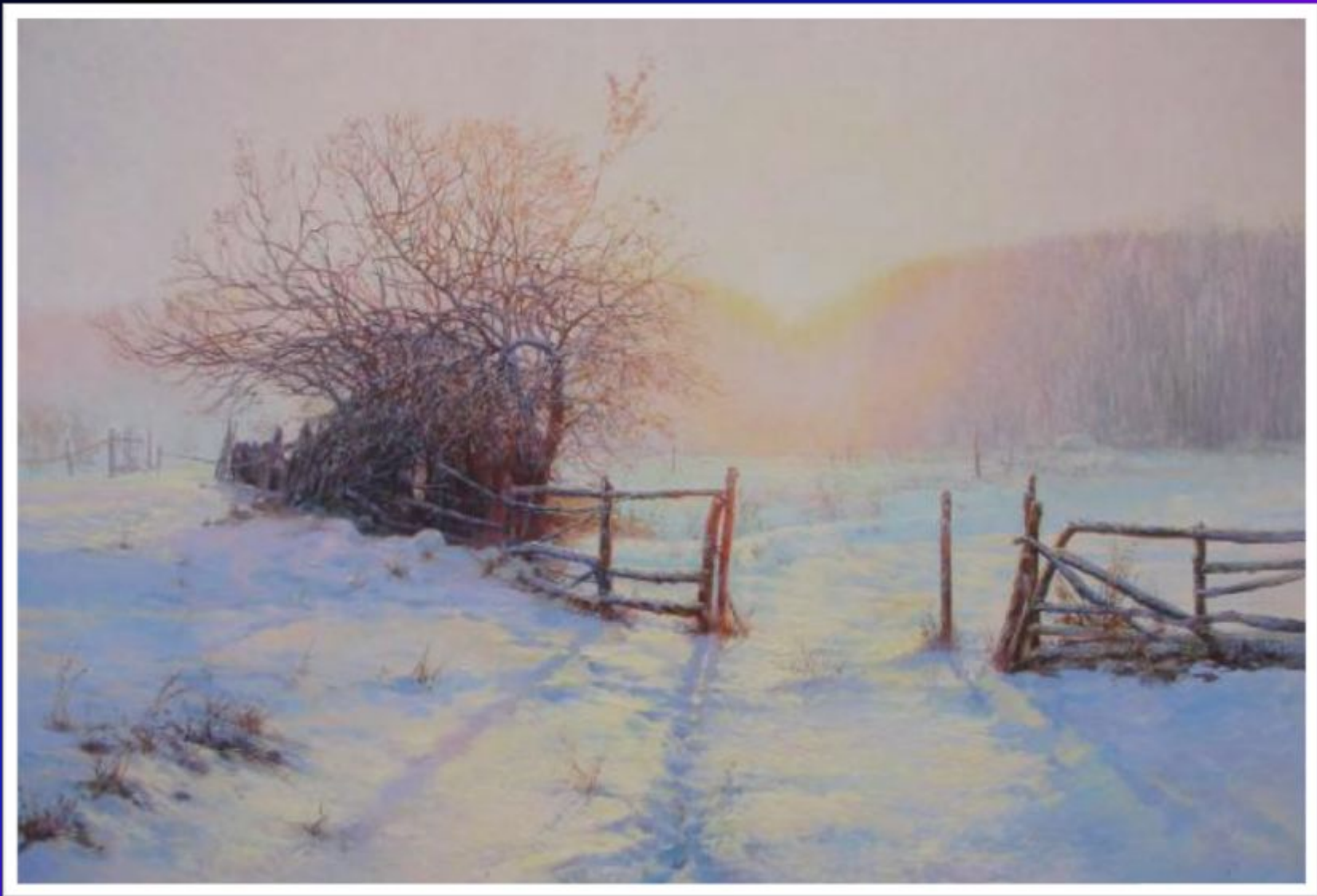
Виктор Грицына «Восход солнца. Утро.»