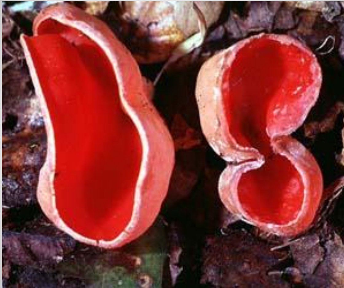
Саркосцифа ярко - красная