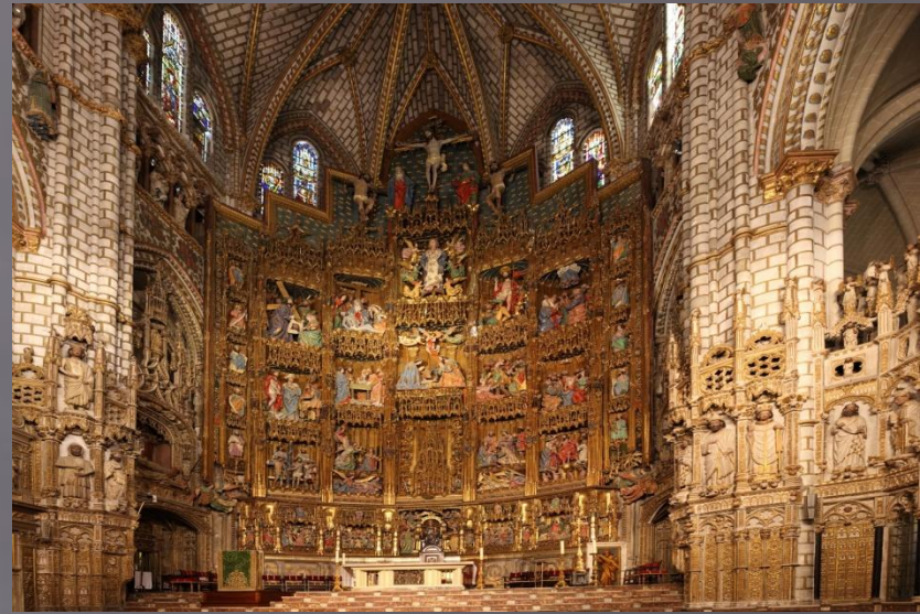
Ретабло Главной капеллы

После победы христиан в битве при Лас-Навас-де-Толоса, король Альфонсо VIII решил построить в Толедо новое здание собора. Однако только при короле Фернандо III старое здание было разрушено, в 1226 году началось строительство современного здания собора, продолжавшееся до 1493 года. Собор был выстроен в готическом стиле с очевидным французским влиянием. Его первым архитектором был Мартин. Собор насчитывает 5 нефов, образованных 88 колоннами и 72 сводами. В XIV веке при архиепископе Педро Тенорио архитектором Родриго Альфонсо к северной стене собора был пристроен клуатр и часовня святого Власия. В XV веке Альвар Мартинес завершил работы над западным фасадом и башней. Завершено строительство собора было в 1493 году при архиепископе Педро Гонсалесе де Мендоса. Дальнейшие изменения в соборе касались только интерьера — в XVI веке собор был украшен целым рядом выдающихся произведений искусства. При кардинале Франсиско Хименесе де Сиснерос была создана мосарабская капелла. Кардинал Хименес де Сиснерос также выступил инициатором создания великолепного ретабло главной капеллы. Кроме того в XVI веке при преемниках Хименеса де Сиснероса были созданы капелла Новых Королей, верхняя часть хоров и их ажурные решётки, сокровищница и ризница.