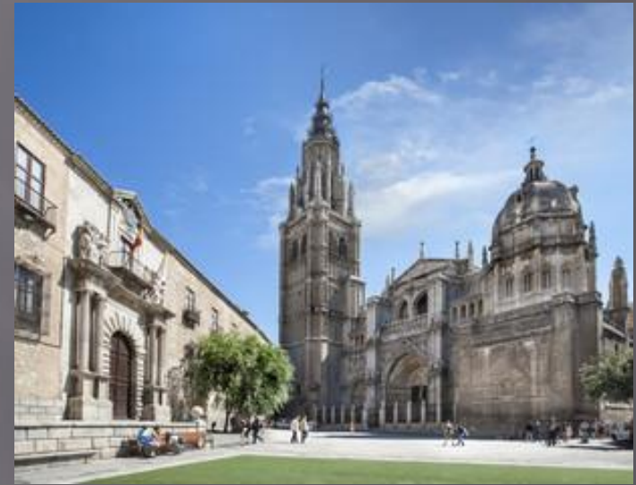
Главный фасад собора и соседний с ним дворец архиепископов

Толедо был отвоеван у мавров Альфонсо VI в 1085 году. После отвоевания Толедо христианами в городе была восстановлена епископская кафедра, первым епископом Толедо стал Бернард де Седирак. Папа Урбан II признал за восстановленной кафедрой статус кафедры примаса Испании. В 1087 году обещание сохранить за мусульманами здание бывшего собора было нарушено, мечеть была переосвящена как христианский храм, с минимальными изменениями в архитектуре. Вплоть до XIII века здание собора-бывшей мечети оставалось нетронутым.