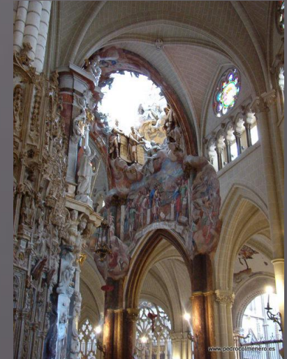
Окно капеллы Транспаренте

Капелла находится на задней стороне Главной капеллы на главной оси собора. Капелла считается шедевром испанского барокко. Она была создана в 1729 – 1732 годах известным испанским мастером барокко Нарсисо Томе. Алтарь капеллы окружён мраморными скульптурами и бронзовыми украшениями. В центре расположена скульптура Девы Марии с Младенцем.