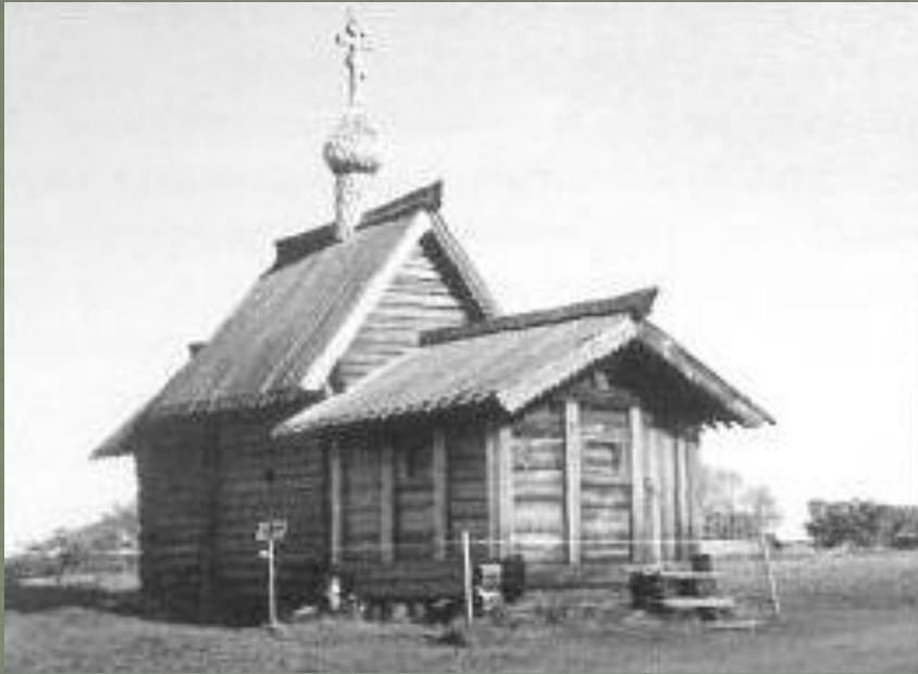
Церковь Воскрешения святого Лазаря

Древнейшая из них — церковь Воскрешения святого Лазаря — находится в музее деревянного зодчества в Кижях в Карелии. Некоторые ученые считают, что она была построена ещё в конце XVI века.