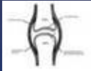
Увеличить (253 кбайт)