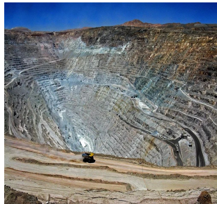
Добыча меди в Чили

Полезные ископаемые региона включают в себя свинцово-цинковые и вольфрамовые руды, запасы сурьмы и ртути, борные, урановые и ванадиевые руды.