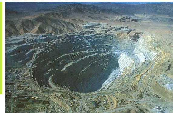
Медный карьер Чукикамата

Страна располагает незначительными залежами нефти и газа