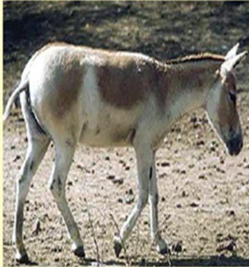
Кулан ( Equus hemionus ).