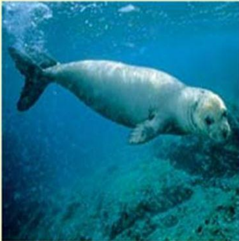
Тюлень-монах. Средиземное море.