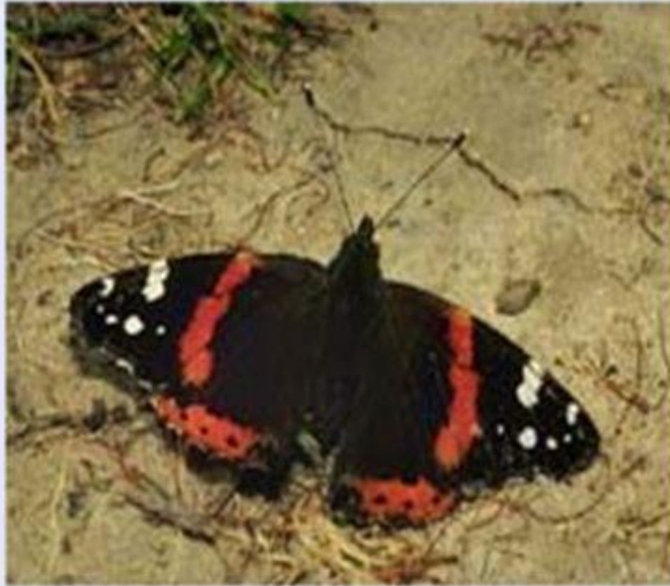
Адмирал ( Vanessa atalanta ).