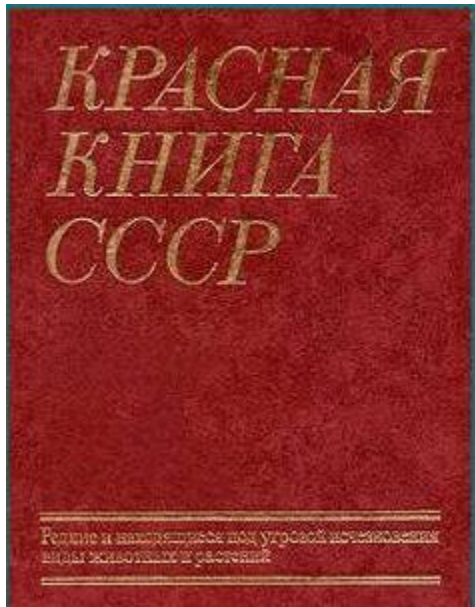
Красная книга СССР(1978 год)