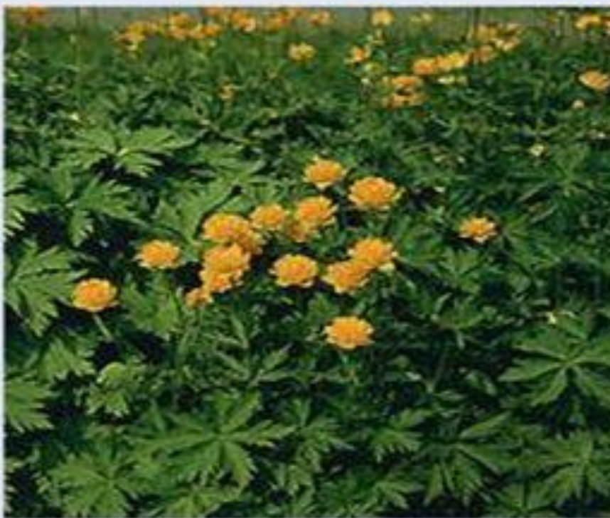
Купальница азиатская (жарки).