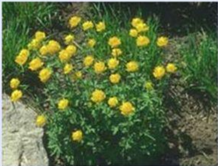
Купальница европейская ( Trollius europaeus ). Крупная садовая форма.