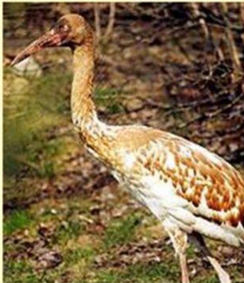
Молодые стерхи (Grus)