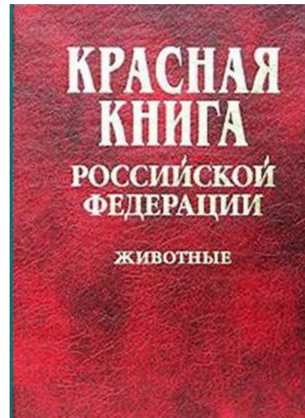
Красная книга России (2001 год)- 231 вид растений и животных