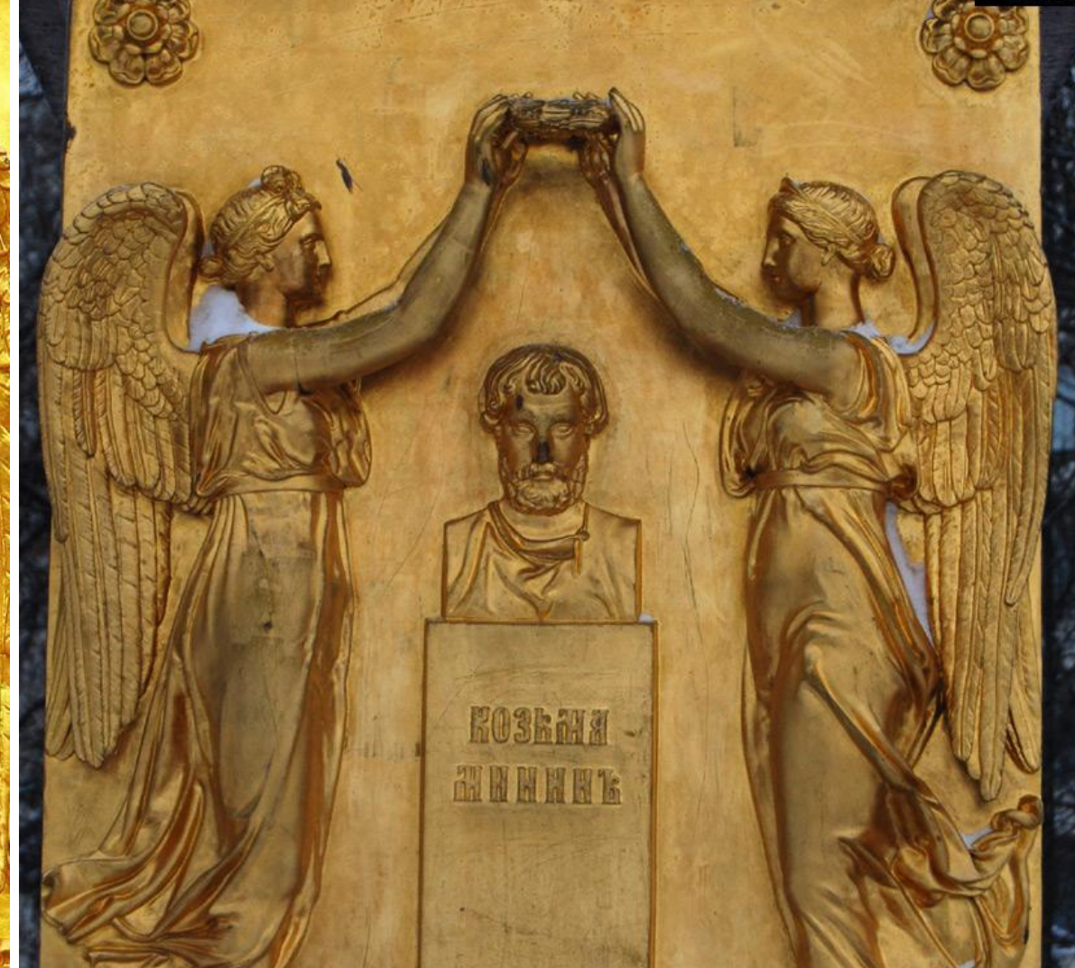
АВТОР РЕЛЬЕФОВ НА ОБЕЛИСКЕ МИНИНУ И ПОЖАРСКОМУ : И.П. МАРТОС