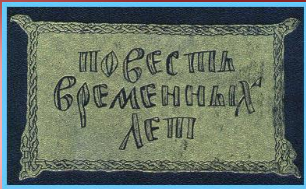
ЛЕТОПИСЬ XII века