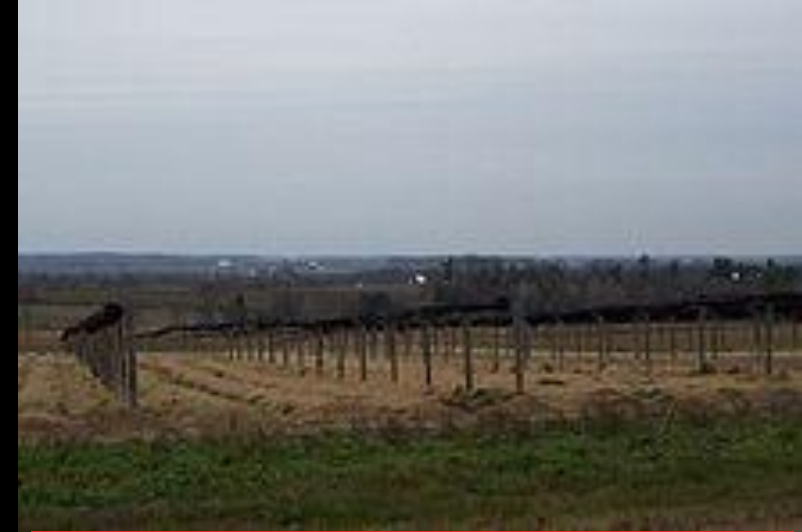
Культивирование в штате Висконсин

Женьшень очень сильно истощает почву, поэтому повторно его можно высаживать не ранее, чем через десять лет. Так как он очень тенелюбивое растение, то все плантации накрыты навесами, которые пропускают не больше 20—30 процентов солнечных лучей. Выращивают растение до четырёх- или шестилетнего возраста, так как именно в 6 лет количество сапонинов достигает максимума. Затем женьшень сортируют по нескольким критериям, среди которых вес и размер корня, наличие или отсутствие отверстий, вид на просвет и даже на схожесть с фигуркой человека. По традиции различают четыре уровня качества женьшеня: «небесный» (англ. heaven), «земной» (англ. earth), «хороший» (англ. good) и «резаный» (англ. cut).