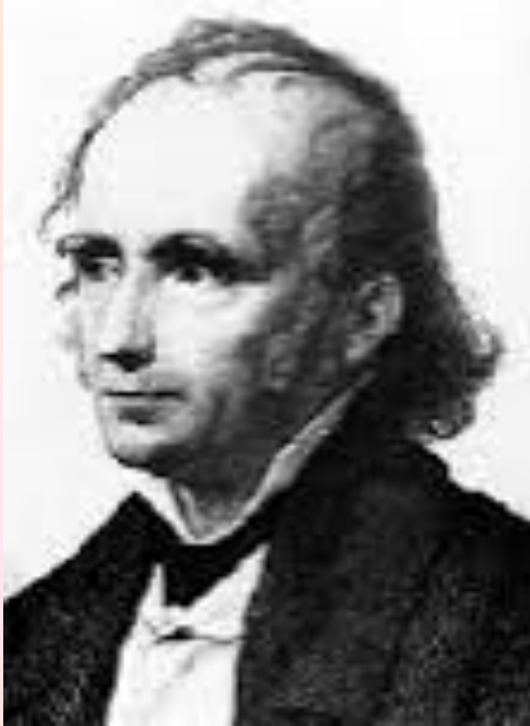
Фридрих Адольф Вильгельм Дистервег 1790- 1866

«Насколько природа детей одинакова, а метод соответствует закону их развития и предмету, настолько все дети обучаются одинаковым образом. Но уже в младшем возрасте проявляются различия, отклонения, особенности, отличительные свойства детей, которые должны быть учтены учителем.