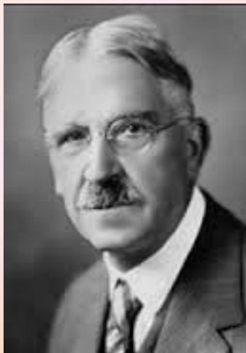
Джон Дьюи 1859-1952