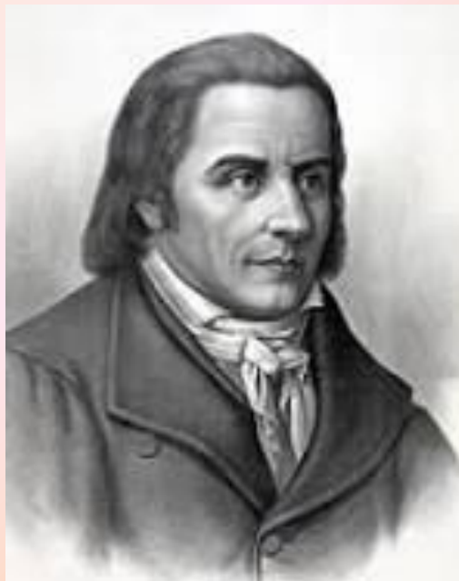
Иоганн Генрих Песталоцци 1746 г. - 1827

"Конечная цель любого научного предмета заключается в основном в том, чтобы совершенствовать человеческую природу, развивая её в максимально высокой степени. ... Поэтому не человеческая природа должна быть приведена в соответствие с научными предметами, а научные предметы с человеческой природой».