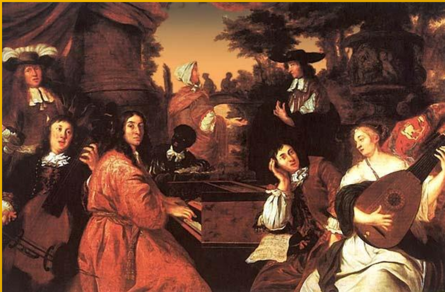
Ансамблевое музицирование. С картины художника Копфа 1675год.