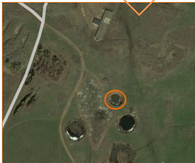
Свалка мусора у д. Николаевка Бирского р-на, 2015 г.