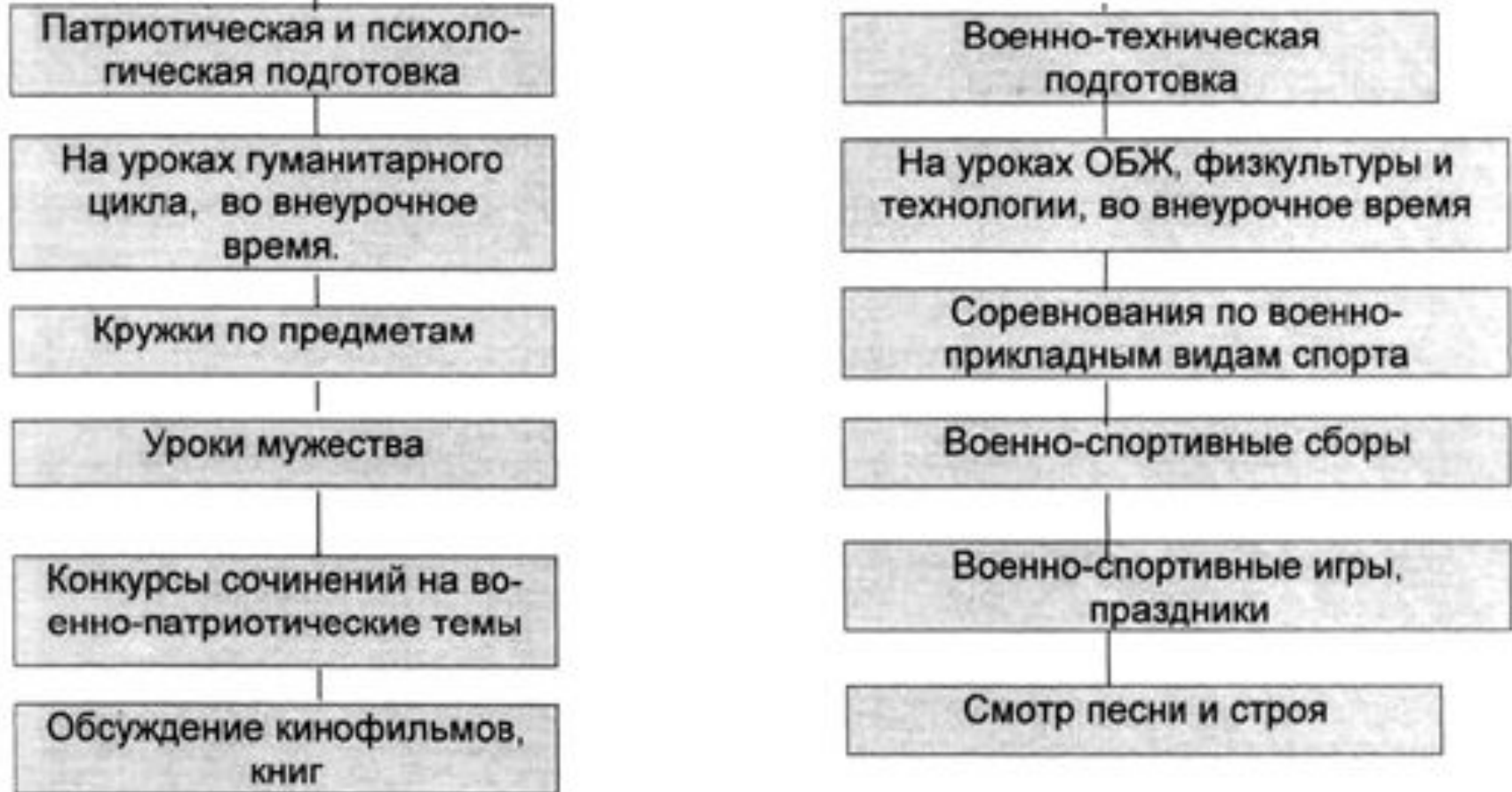
Рисунок 1. Система военно-патриотической работы в школе.