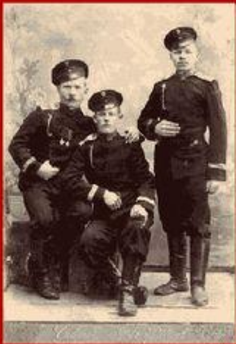
Участники Первой мировой войны

Таким образом, исторически сложилась система воинского учёта всех граждан России.