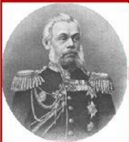
Милютин Дмитрий Алексеевич

В 1874 году в результате проведения военных реформ военным министром Д. А. Милютиным в России была введена всеобщая воинская повинность для мужского населения, достигшего возраста 21 года. Призывники тянули жребий и этим определяли, кто должен идти служить в этом году.