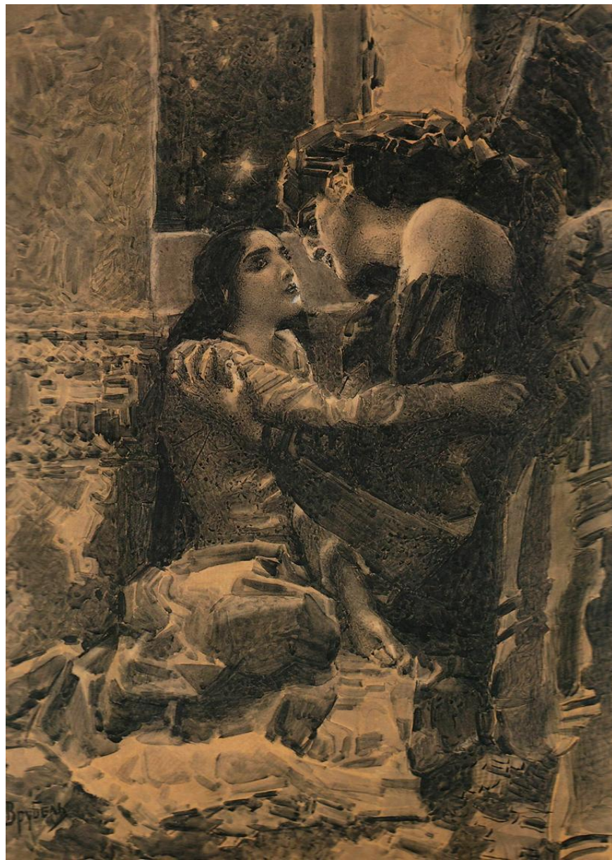
Тамара и Демон. 1890 г.