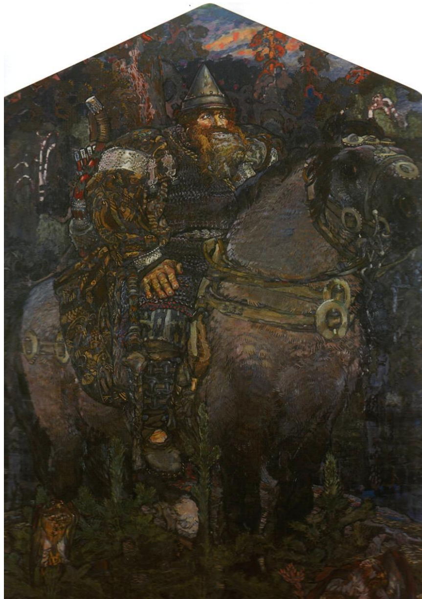
Богатырь. 1898 г.