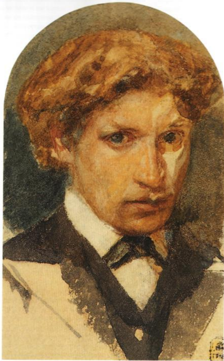
Автопортрет. 1882 г