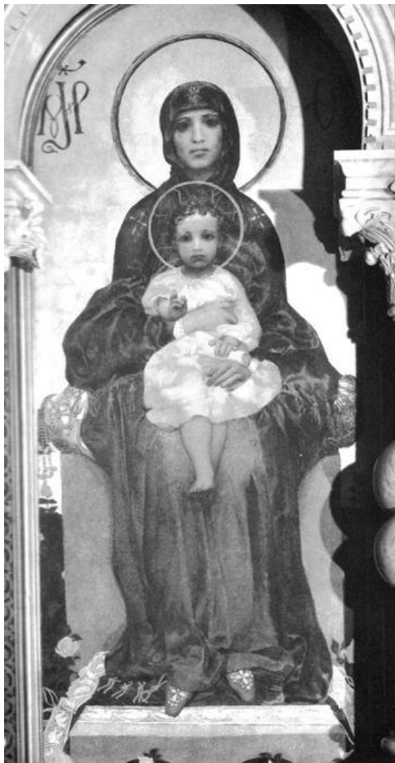
Богоматерь с Младенцем. 1885