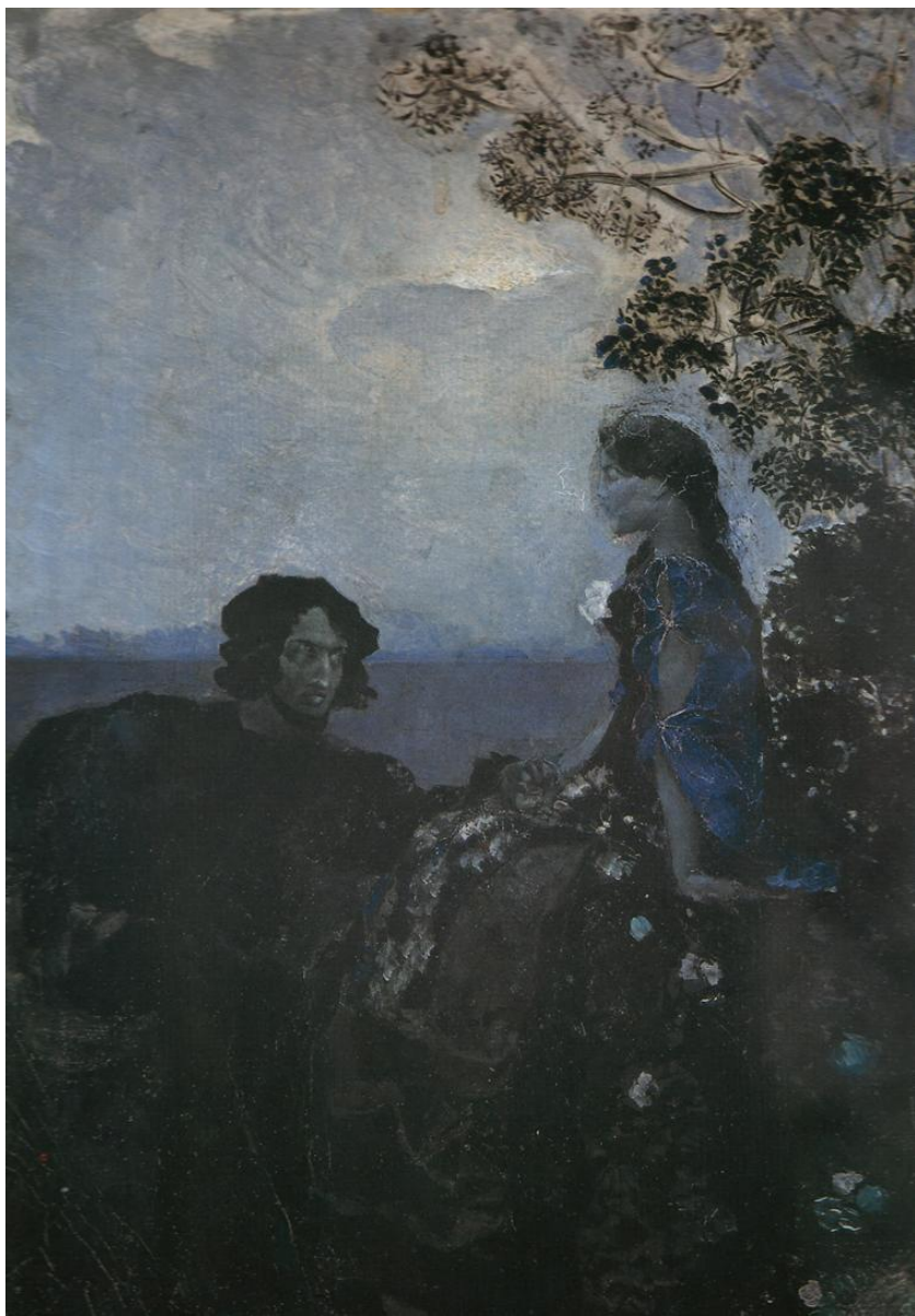
Гамлет и Офелия. 1888 г.