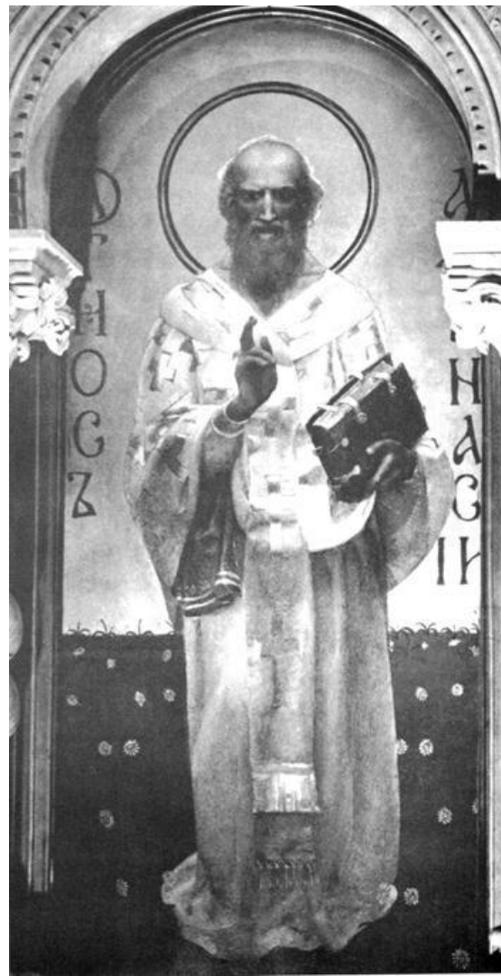
Святой Афанасий. 1885