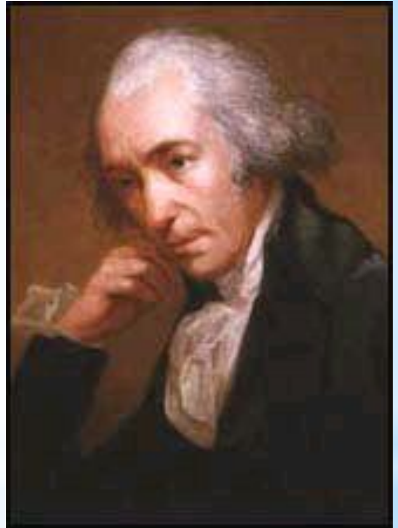
James Watt (1736-1819)

К концу 18 века Джеймс Уатт заканчивает разработку своей первой, универсальной паровой машины. Она дала толчок для зарождения первого паровоза.