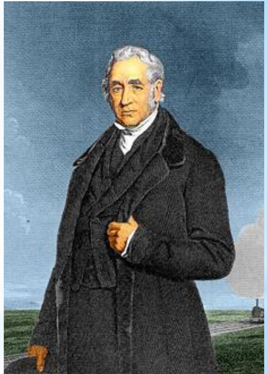
George Stephenson (1781 — 1848)

Удачнее других оказались локомотивы, сконструированные и построенные Джорджем Стефенсоном. В 1812 году он начал строить свой первый паровоз.