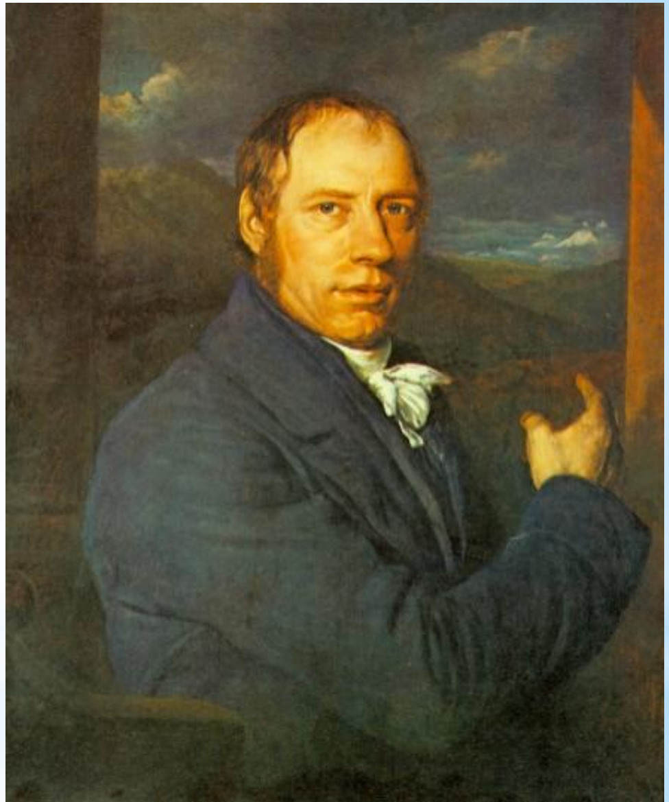
Richard Trevithick (1771 — 1833)

24 марта 1802 года Ричард Тревитик получил патент на паровоз. В 1804 году первый паровоз был построен.