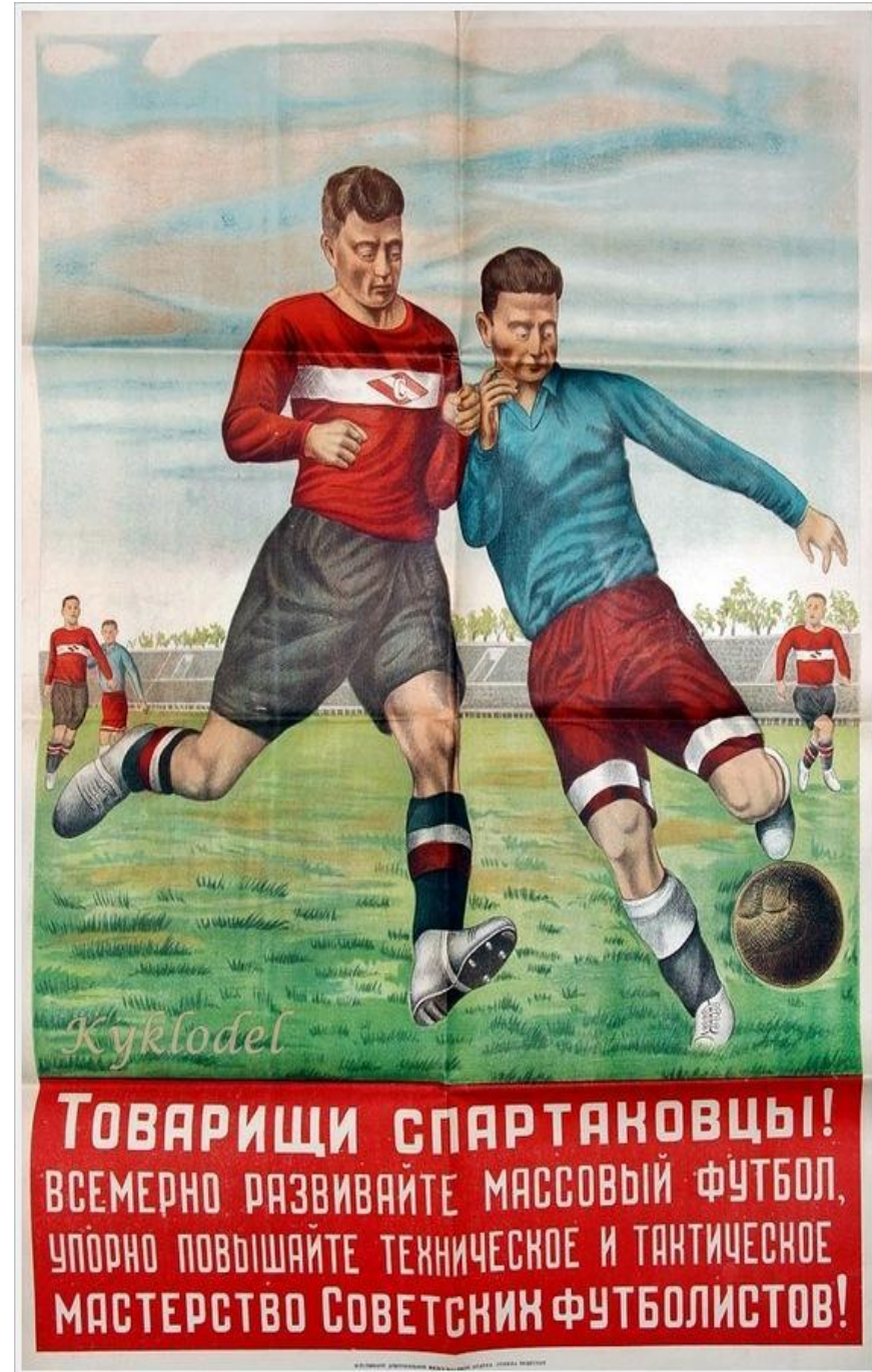
ИЛЛЮСТРАЦИЯ КОЛЛЕКТИВА ХУДОЖНИКОВ МОСКОВСКОГО ГОСУДАРСТВЕННОГО УНИВЕРСИТЕТА