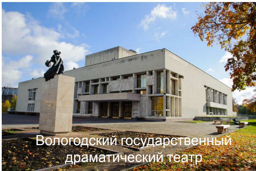
Вологодский государственный драматический театр