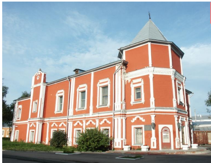
Вологодский областной театр кукол «Теремок»