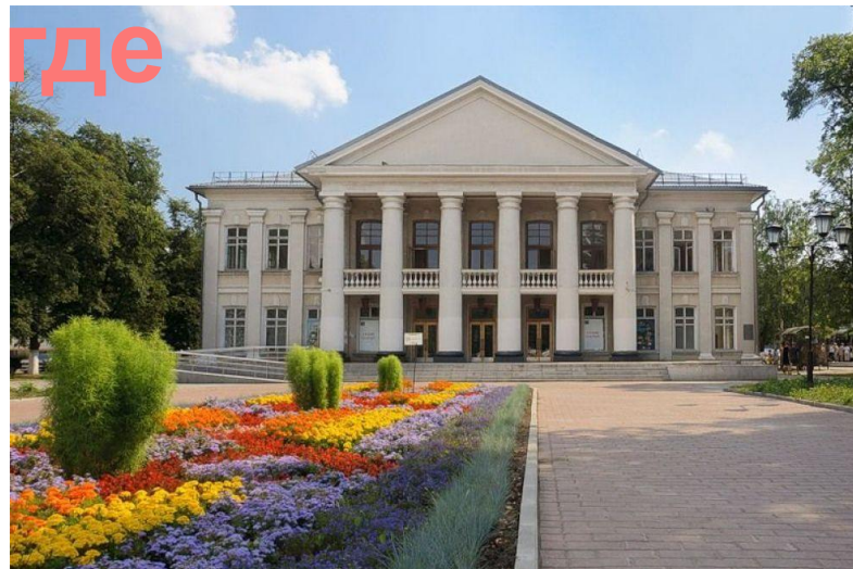
Вологодский театр юного зрителя