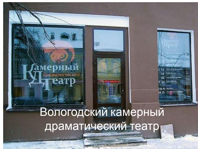
Вологодский камерный драматический театр