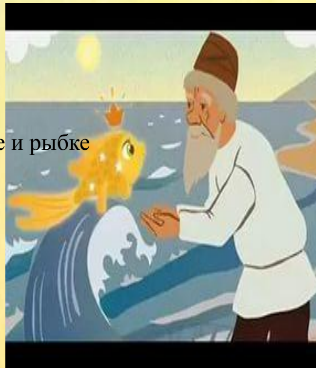
Сказка о рыбаке и рыбке