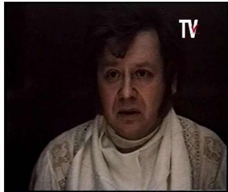
Илья Ильич Обломов из романа «Обломов».