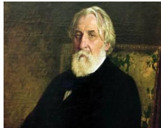
И.С.Тургенев «Отцы и дети»

3) Под влиянием различных смутных чувств , сознания уходящей жизни, желания новизны она заставила себя дойти до известной черты, заставила себя заглянуть за неё – и увидала за ней даже не бездну , а пустоту ... или безобразие .