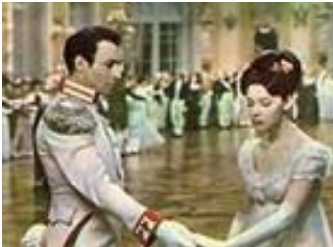
Андрей Болконский и Наташа Ростова . «Война и мир».

Сидя подле неё, разговаривая с нею о самых простых и ничтожных предметах, князь Андрей любовался на радостный блеск её глаз и улыбки, относившейся не к говорённым речам, а к её внутреннему счастью. (обособл. обст., обособл.опр.)