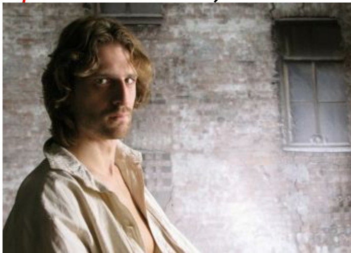
Родион Раскольников из романа «Преступление и наказание».

1) Раскольников разглядел худенькое, но милое личико девочки, улыбавшееся ему и весело на него смотревшее. (Осложнено однородными членами и обособленными определениями.)