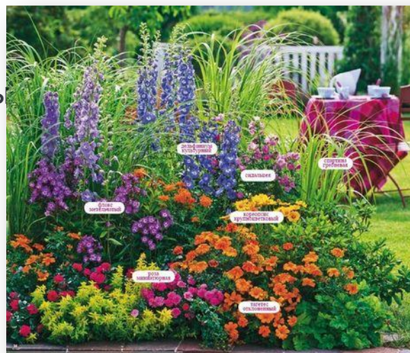
Перечень растений в цветнике: Баптизия южная, ирис восточный, пион традесканция гибридная, Герань гибридная