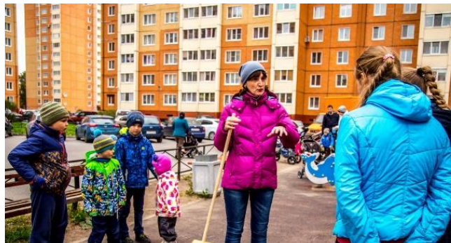
НЕ ИЖДИВЕНЦЫ, А РЕСУРСЫ ДЛЯ ОБЩЕСТВА