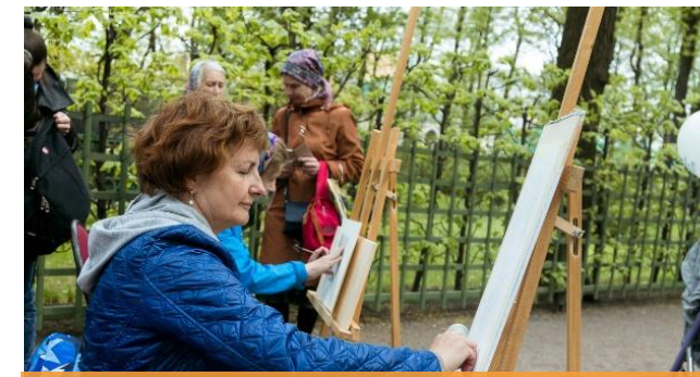
ОБУЧЕНИЕ И РАЗВИТИЕ