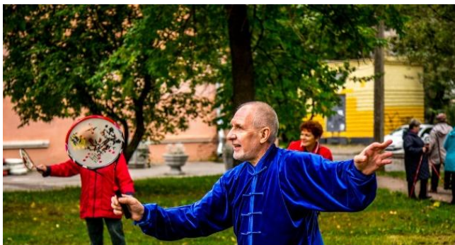
УХОД ОТ БЫТОВОУХИ