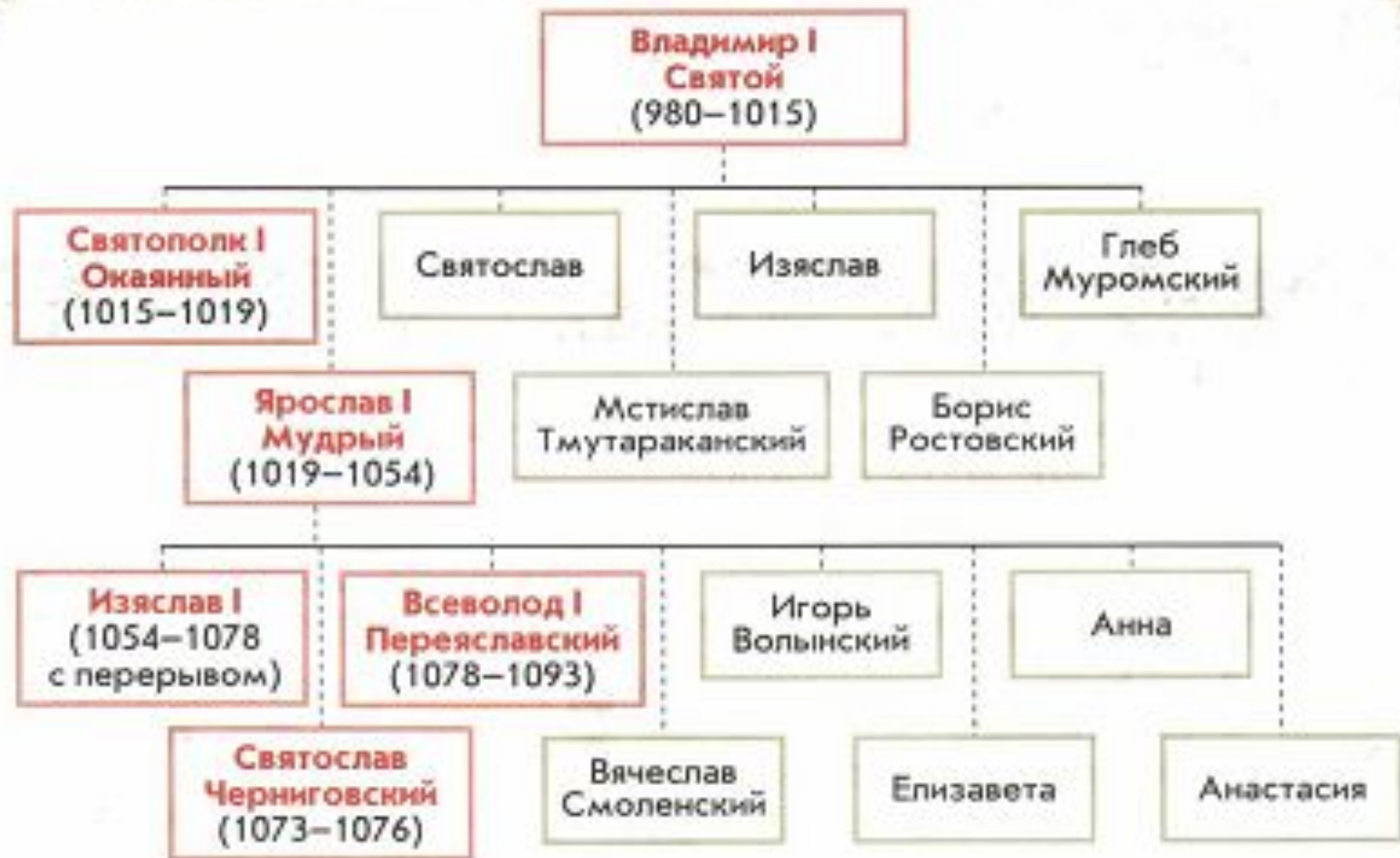
Родословная Рюриковичей. Конец X–XI в.