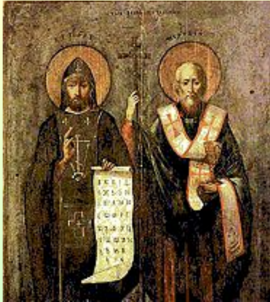
Славянские просветители, братья КИРИЛЛ и МЕФОДИЙ