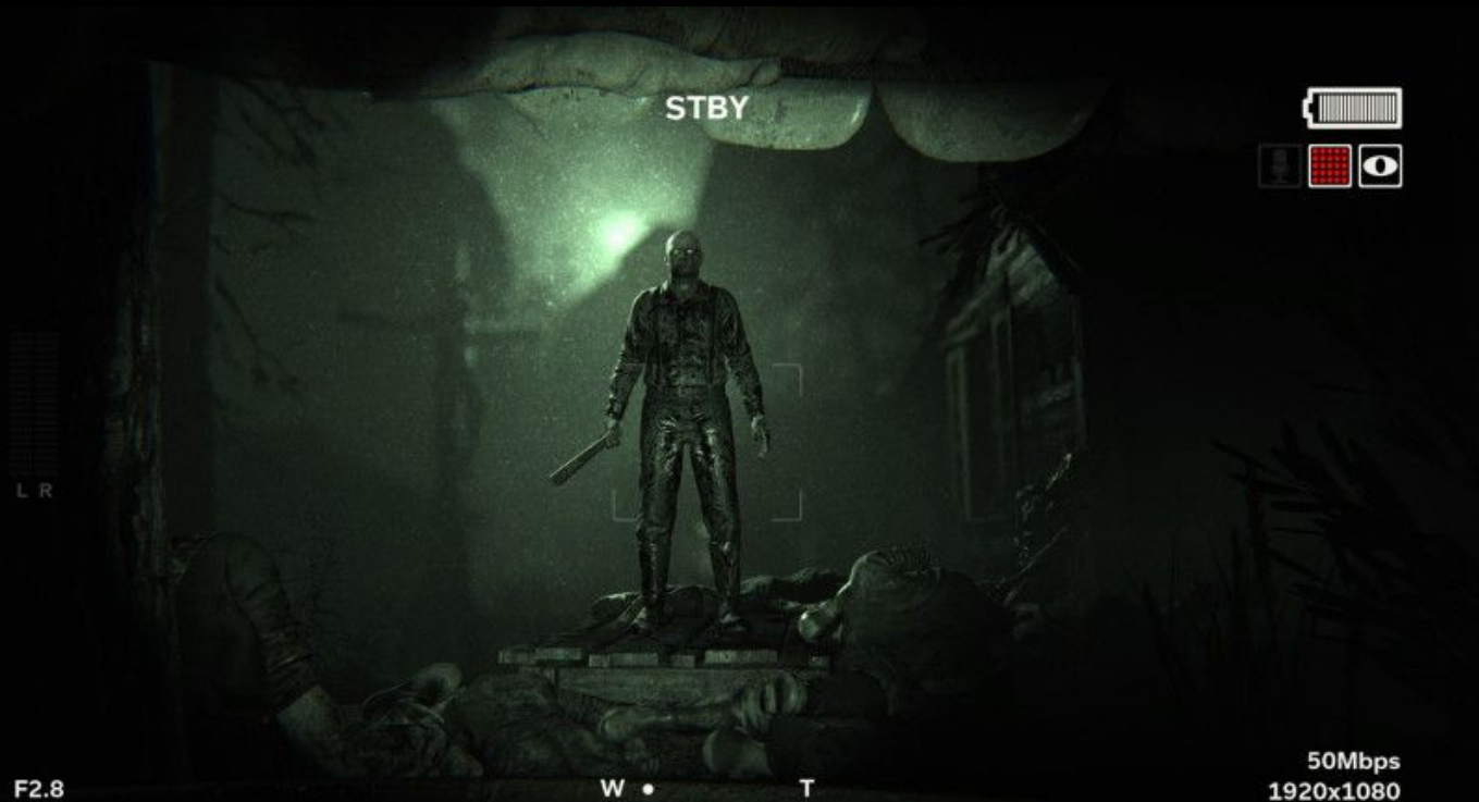
"Outlast" by Red Barrels

Жанр игры: Survival horror, от первого лица, возможен кооперативный режим с вторым игроком.