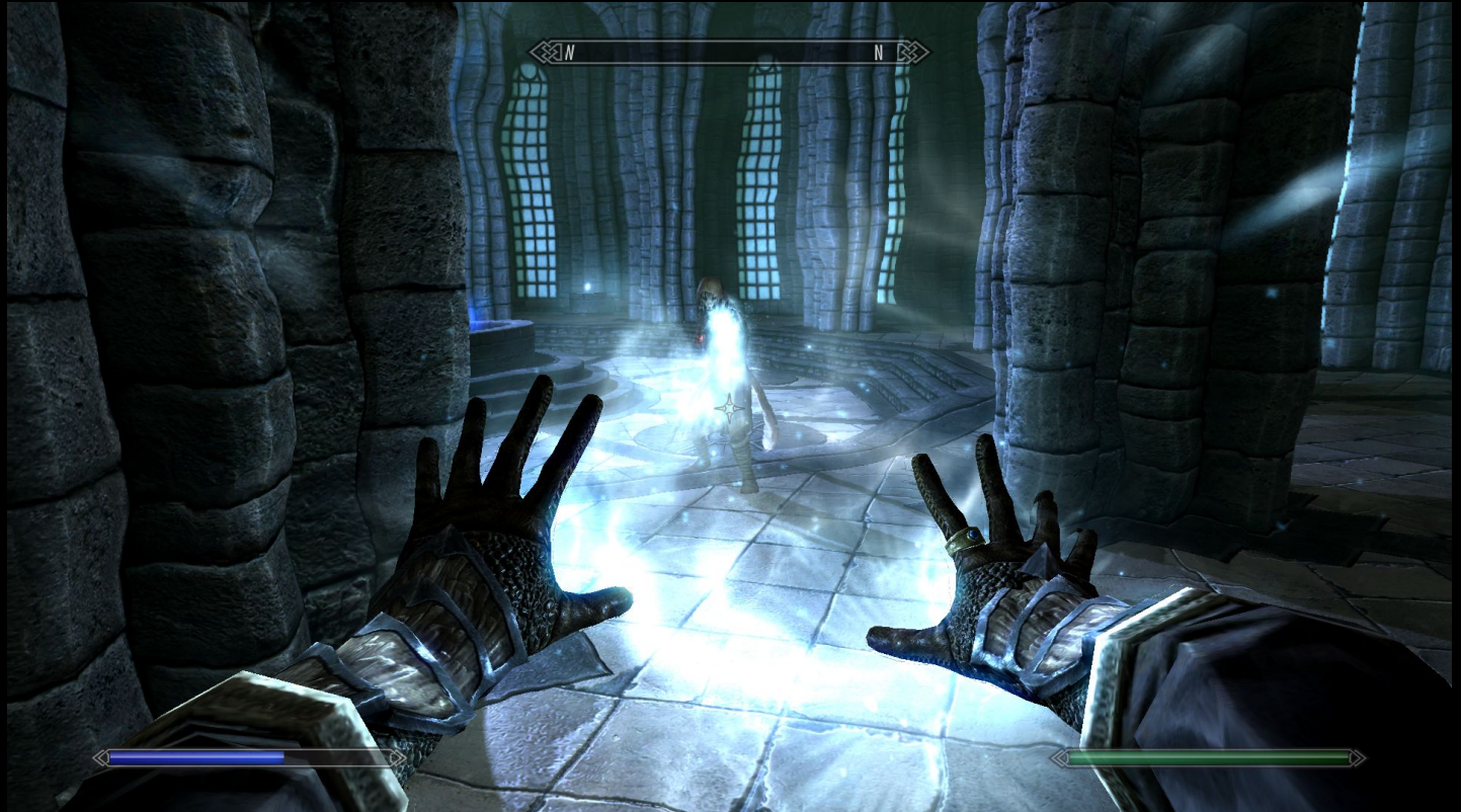
“The Elder Scrolls V: Skyrim” by Bethesda Softworks

У второго игрока есть способность изгонять духов случайным подбором заклинаний. Можно догадаться, как справится с врагом, понаблюдав за его поведением.