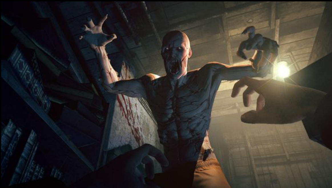
“Outlast” by Red Barrels

У персонажа есть несколько видов заклинаний, которые тот может комбинировать между собой. В зависимости от природы врага он даже может защититься ими. Но проблема в том, что кроме тварей не от мира сего есть еще и люди, а от них можно только убежать.