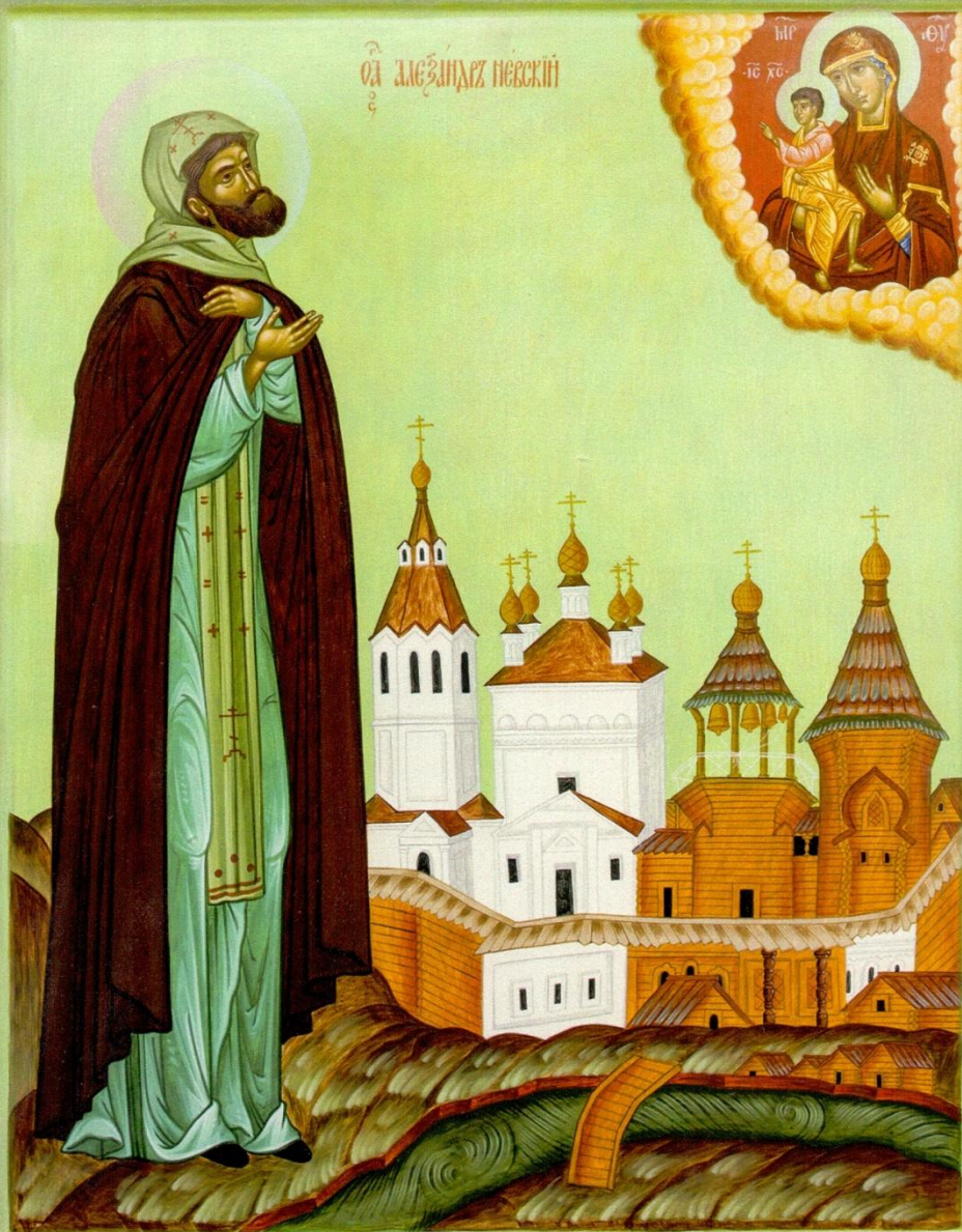
Святой благодарный князь Александр Невский