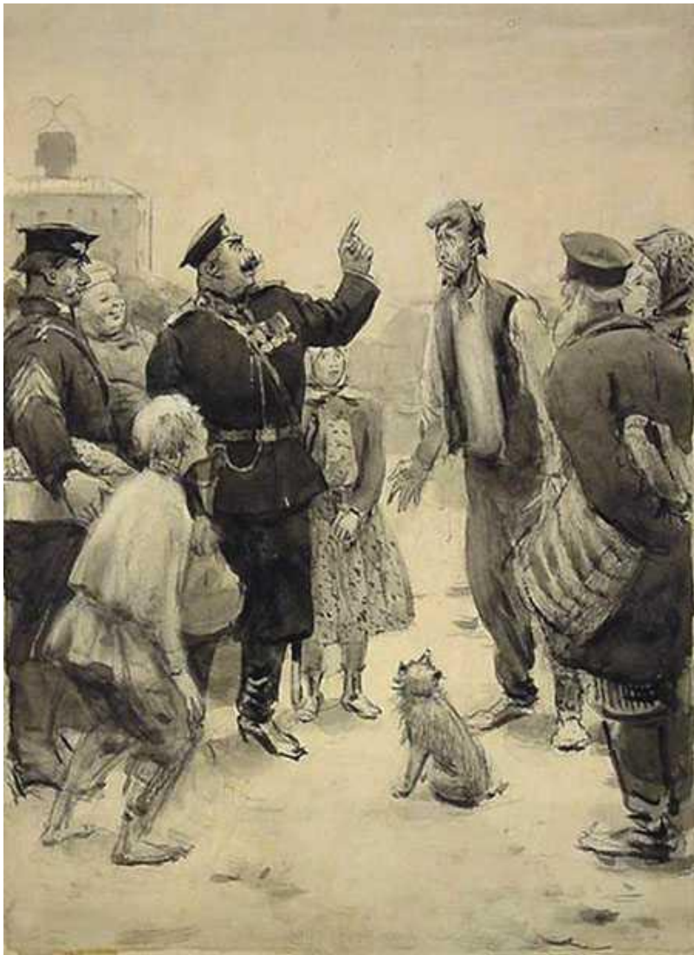
С.В. Герасимов. Иллюстрация к рассказу А.П. Чехова «Хамелеон» ( 1945)