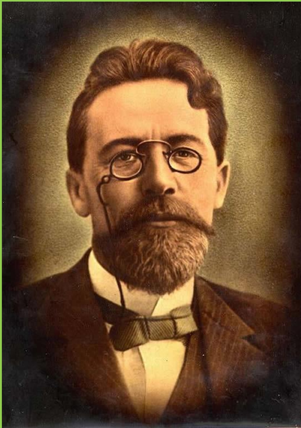
АНТОН ПАВЛОВИЧ ЧЕХОВ