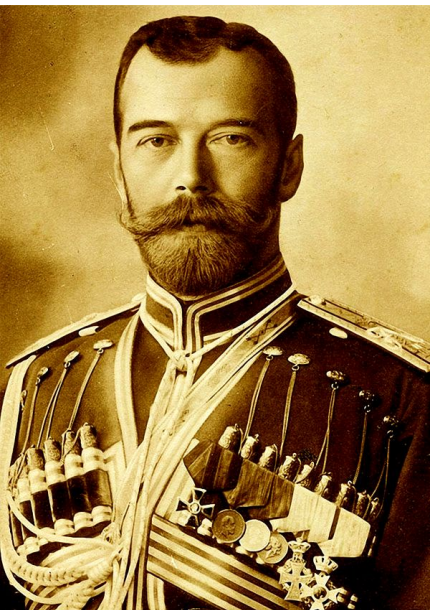
Николай II (1868-1918 гг.)