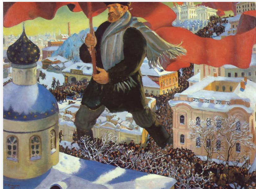
Картина художника Б.М. Кустодиева «БОЛЬШЕВИК» (1920 г.)