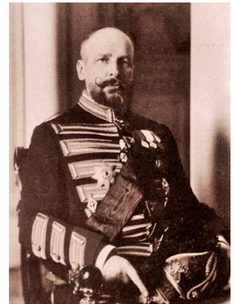
Председатель Совета министров России 1906-1911 гг. П.А. Столыпин (1862-1911 гг.)