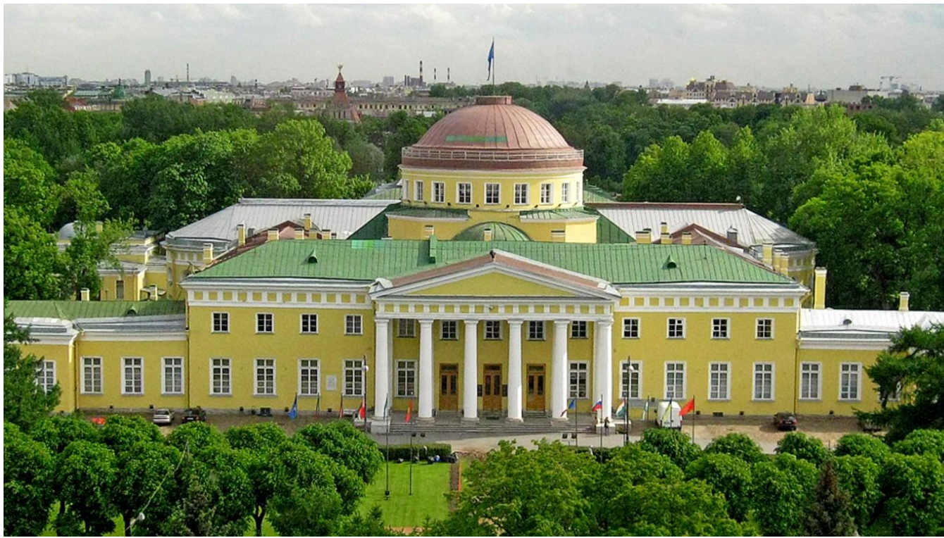
г. Санкт-Петербург, Таврический дворец Государственная Дума Российской империи 1906-1917 гг.