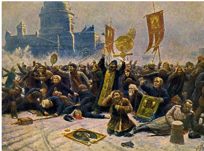
Этюды картины художника В.Е. Маковского «9 января 1905 года на Васильевском острове» (1905-1907 гг.)