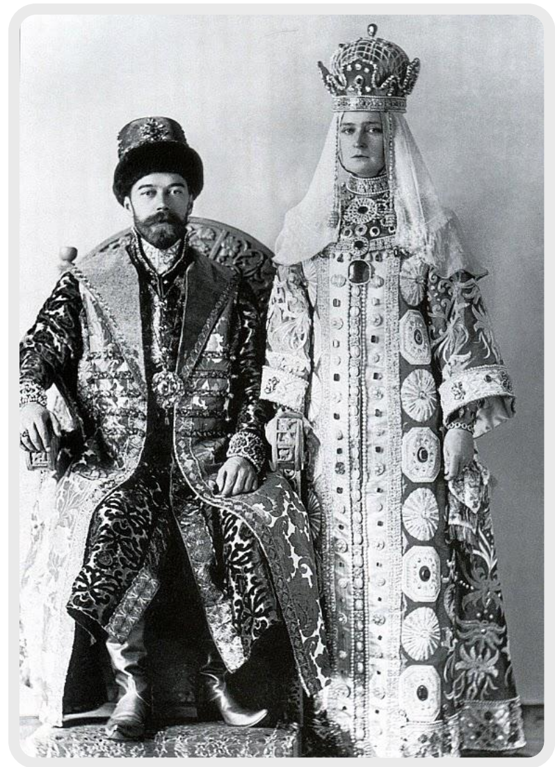
Николай II с женой Александрой Фёдоровной (Викторией Гессен- Дармштадтской)