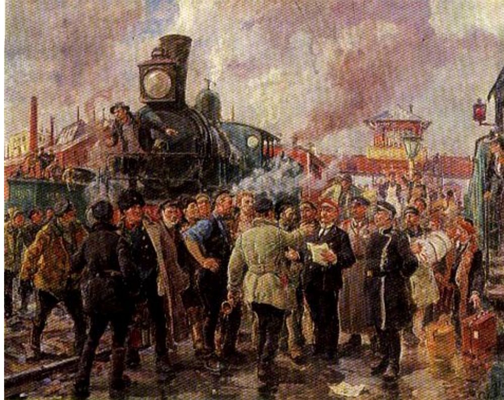
Картина художника Г.К. Савицкого « Всеобщая железнодорожная забастовка » (1930 г.)