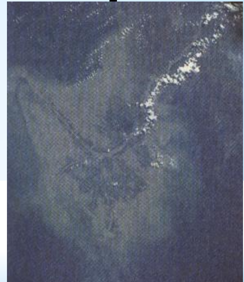
Вид из космоса