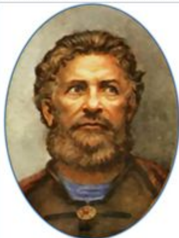
Афанасий Никитин (около 1433 — 1472)