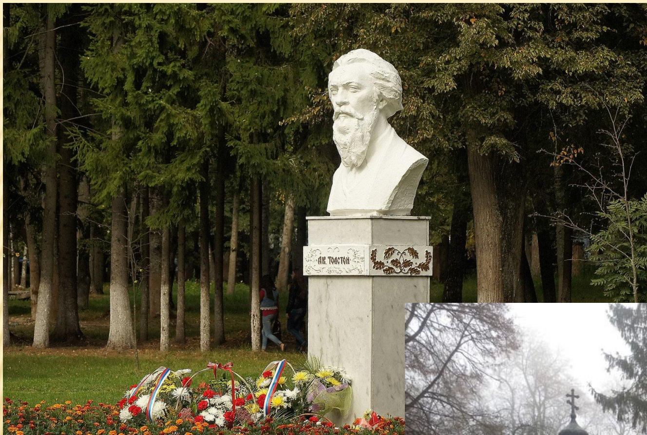
Памятник и склеп А.К. Толстому Красный Рог.

28 сентября 1875 года, во время очередного приступа головной боли, А. К. Толстой ввёл себе слишком большую дозу морфия (который принимал по предписанию врача), что привело к его смерти