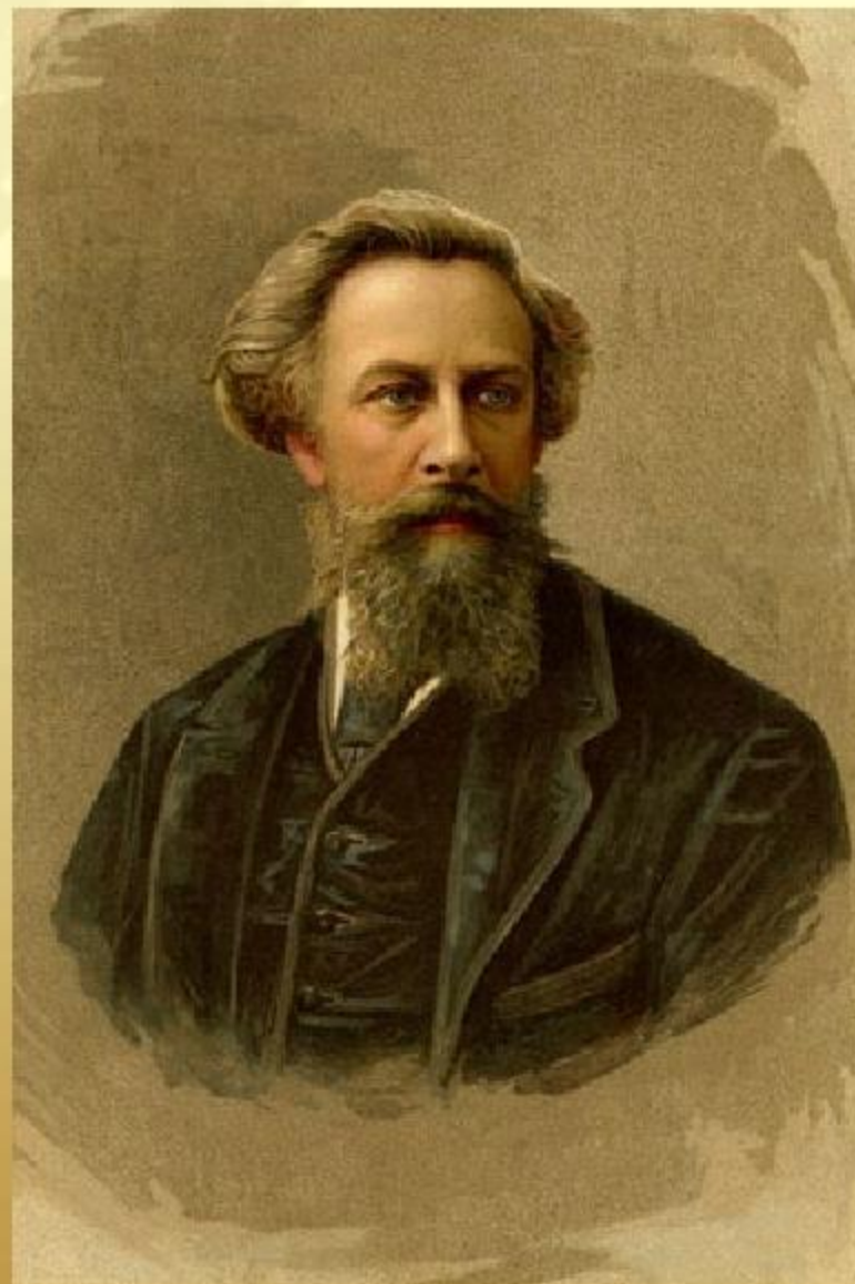
А. К. Толстой