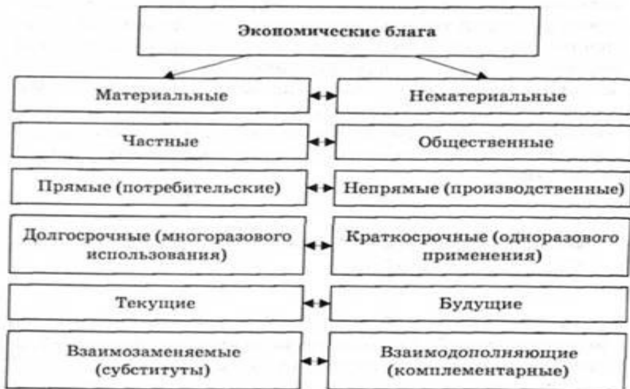
Рис. 5.14. Классификация экономических благ

Экономические блага — это блага трудовой деятельности человека, которые существуют в ограниченном количестве.