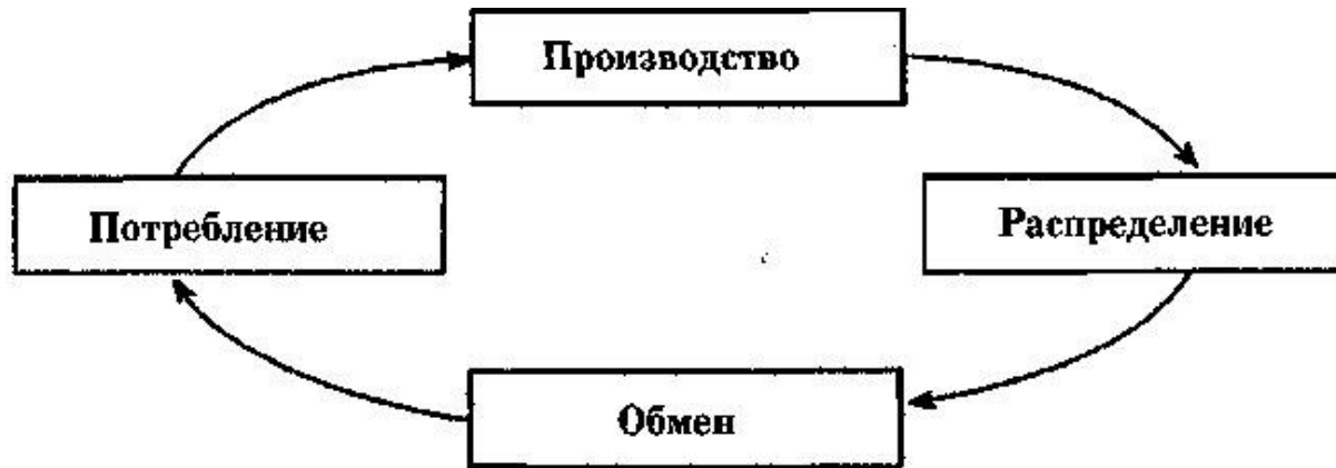
Рис. 1.2. Стадии движения продукта труда

Воспроизводство - это процесс постоянного повторения производства