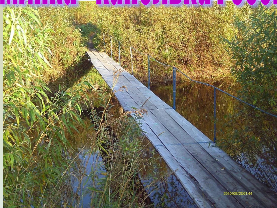
Мостик через Вагай