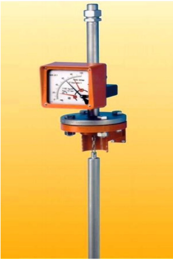
Буйковый ВА – R