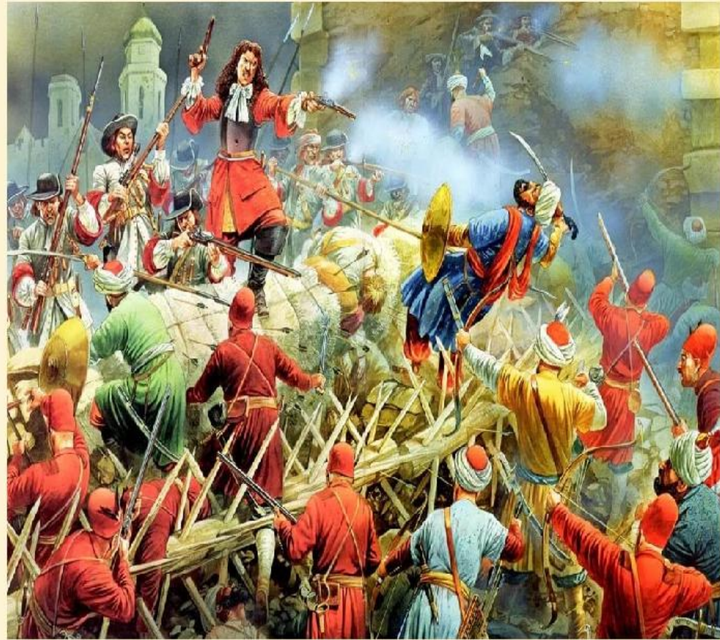
Оборона Вены от турок в 1683 году

Огромная многонациональная армия Османской империи летом 1683 г. осадила фактическую столицу империи — Вену.