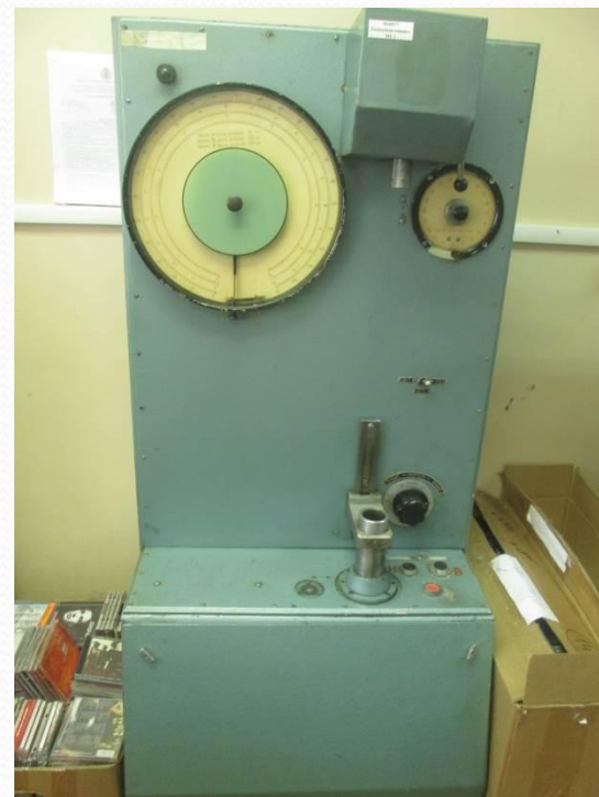
РТЭ250-М машина для определения прочности материала