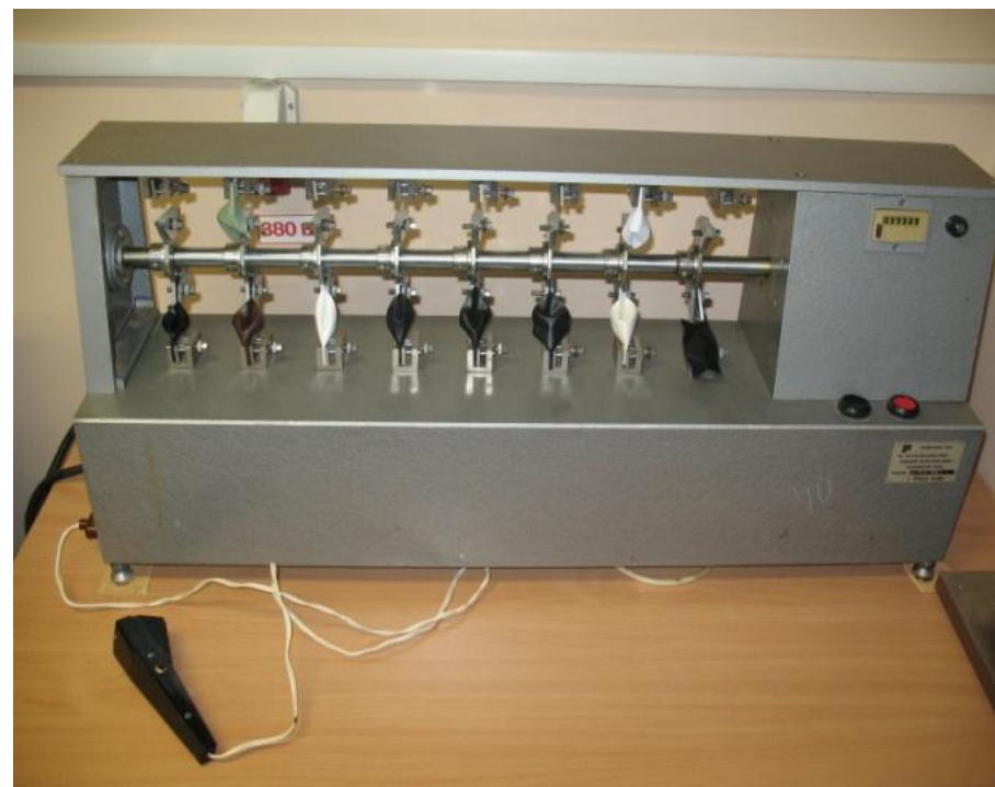
ИПК-2м для испытания устойчивости к изгибу