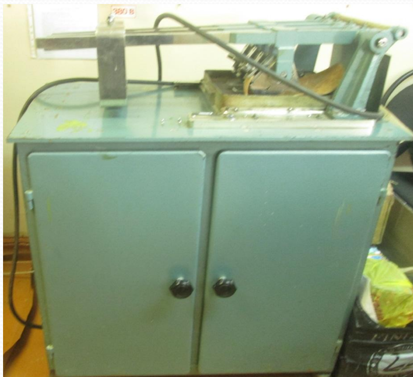
ИКВ прибор для определения устойчивости материалов к истиранию во влажном состоянии