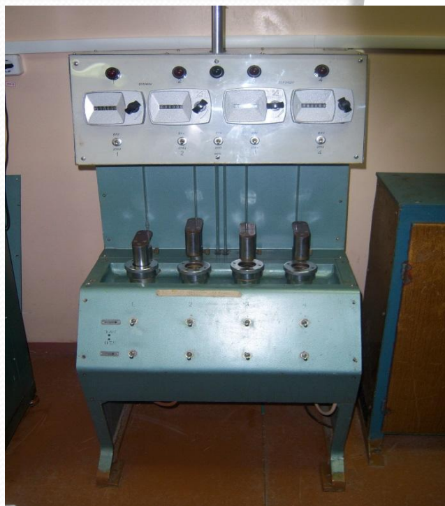
ПВС-2 для исследования водо- и воздухопроницаемости