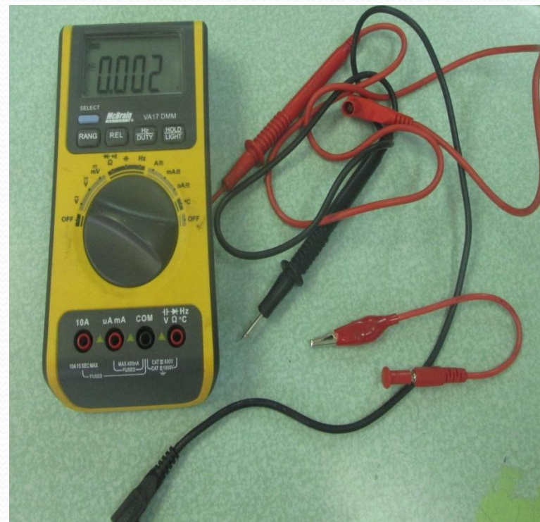
Мультиметр VA17 универсальный электроизмерительный прибор