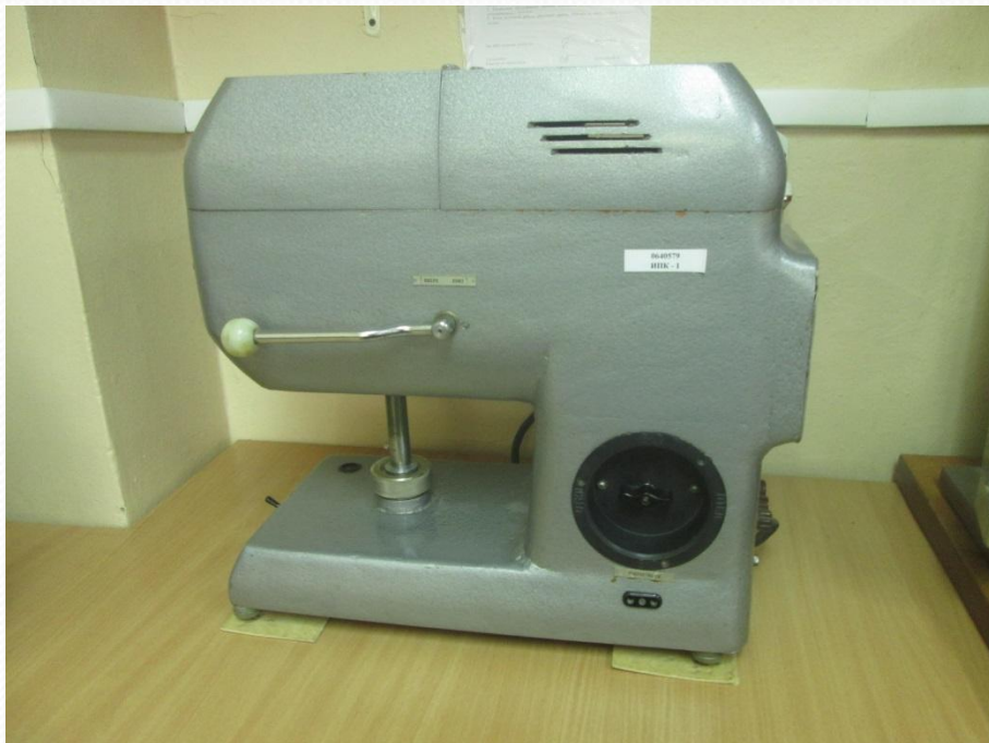
ИПК-1 для испытания устойчивости покрытия материалов к истиранию