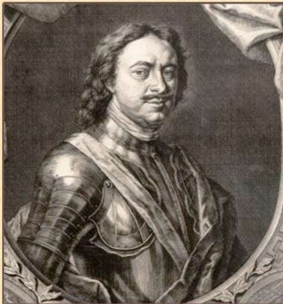
ПЕТР I. КАРЛ МООР. 1717 Г.