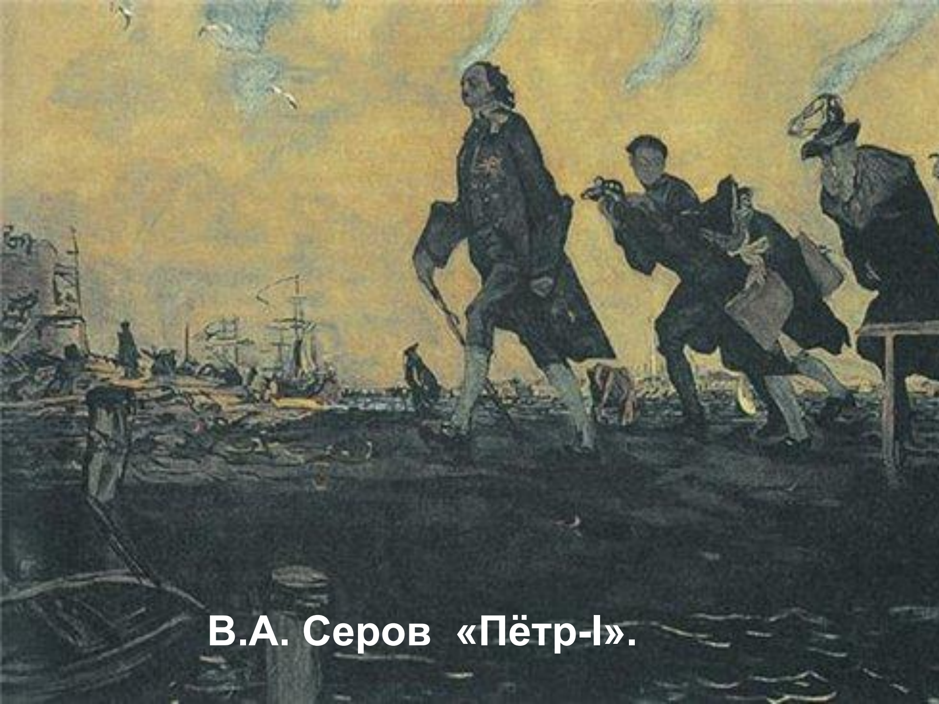
В.А. Серов «Пётр-1».