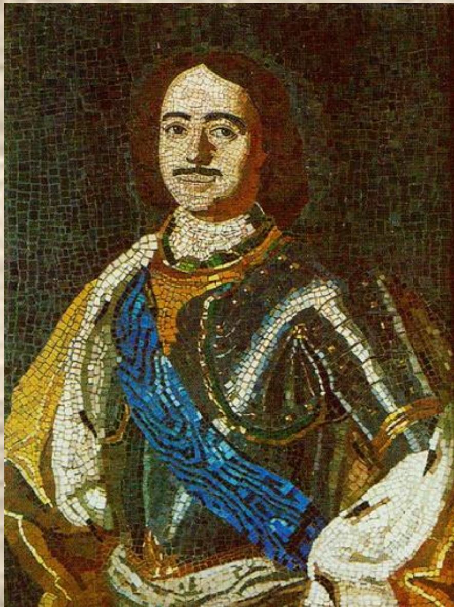
«Портрет Петра I» М. В. Ломоносов