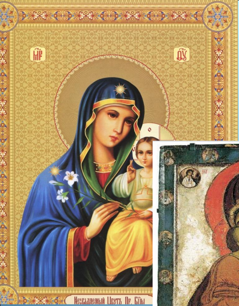
Исходный Цветъ Пр. Бѣны