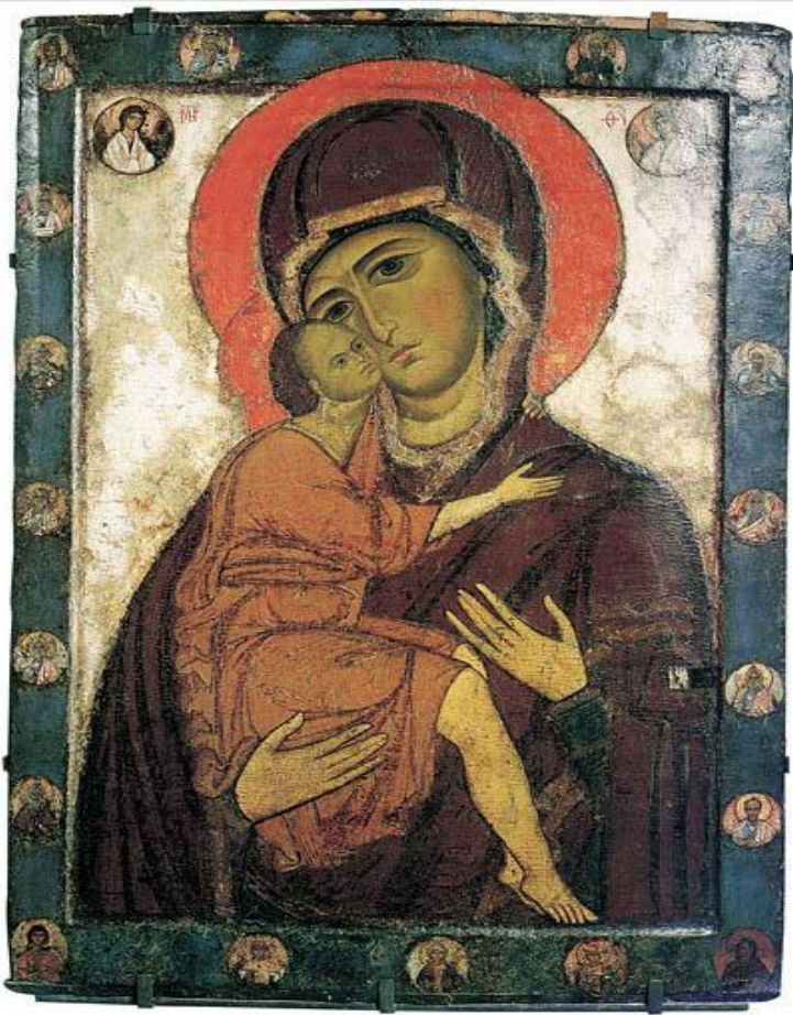
Богоматерь Умиление Белозерская. Первая пол. 13 в.